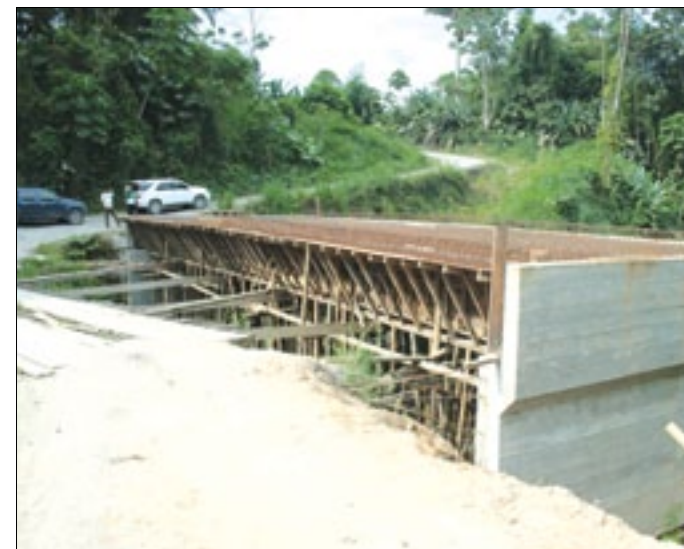
Puente sobre el río Chipo-Quinindé