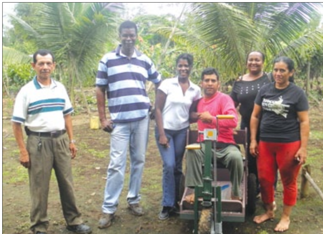
Beneficiario, Presidente de la junta parroquial de Malimpia y técnicos del Patronato