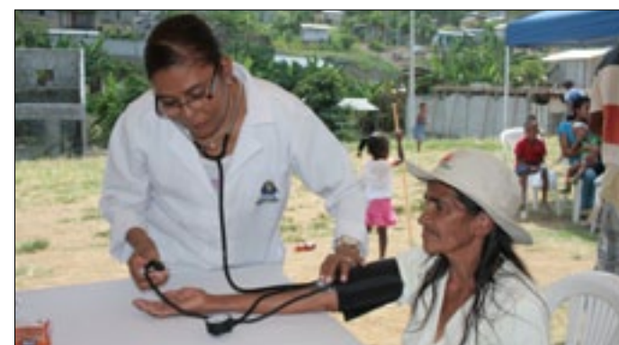
Previo a la atención se chequea los signos vitales

permita atenderse de manera preventiva y gratuita. Los beneficiarios con entusiasmo expresaban su gratitud por la atención médica y los fármacos que recibieron de forma gratuita lo que es de gran ayuda sobre todo para los niños quienes fueron desparasitados durante la jornada y se les dio a los padres para que culminen el tratamiento en sus domicilio, posterior a ello deben iniciar con dosis de hierro y vitamina.