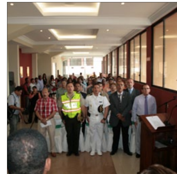
Representantes de instituciones en la inauguración

La sala memorial Luis Vargas Torres, situada en el primer piso alto del Teatro Cívico Tácito Ortiz Urriola, contiguo al edificio de la Prefectura abre sus puertas al público en general y de manera especial a los estudiantes de los diferentes establecimientos educativos de la provincia.