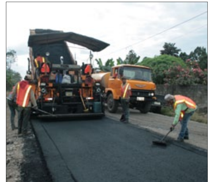
Obreros en labores de asfaltado

la ejecución de estos trabajos, pese a no haberse considerado en el proyecto y por ende no estar presupuestados los recursos para la construcción de cunetas de hormigón, analizan la posibilidad de intervenir en los tramos más críticos, donde la cantidad de agua que se produce en cada lluvia, podría poner en riesgo la pérdida del material colocado sobre la mencionada carretera.