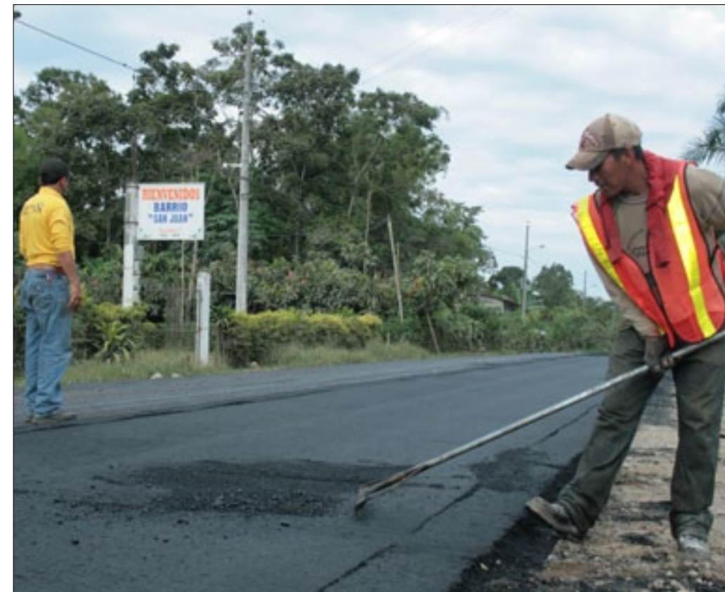
Vía Unión el Silencio-Quinindé asfaltada íntegramente

Autoridades preparan la inauguración de la vía