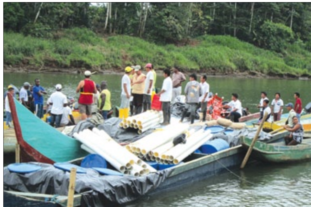
Material entregado a los habitantes de las comunidades Chachis

Con el propósito de fortalecer los proyectos de soberanía alimentaria que se viene impulsando en beneficio de varias comunidades asentadas en el cantón Eloy Alfaro, el pasado 18 de septiembre las autoridades de la Prefectura de Esmeraldas procedieron a realizar la entrega de materiales para la construcción de galpones a utilizarse para la cría de cerdos, gallinas, patos entre otros animales de corral, contribuyendo de esta manera a apuntalar la economía y alimentación de las familias de las 19 comunidades chachis y negras que pertenecen a la Parroquia Atahualpa. Los materiales como cemento, bloques, planchas de zinc, tubos, carretillas, palas entre otros fueron trasladados por vía fluvial en tres enormes lanchas hasta la comunidad Sta. María de los Cayapas, lugar donde