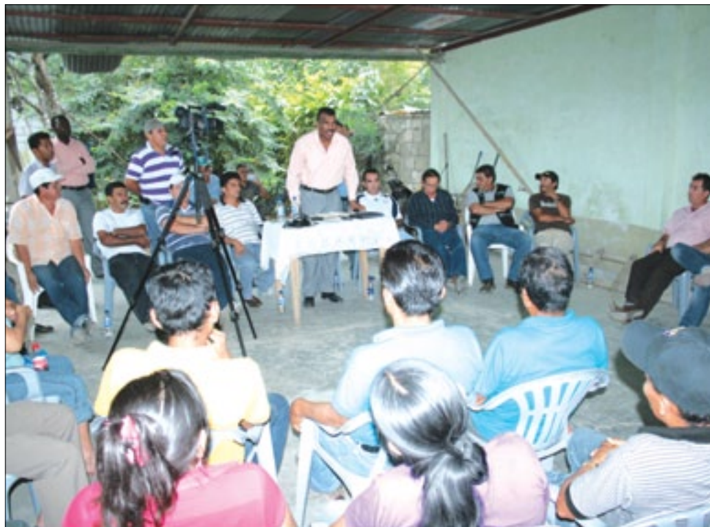
Prefecto atiende pedidos de habitantes de la Unión de Quinindé

En la cabecera parroquial de la Unión en el cantón Quinindé el Prefecto Rafael Erazo se reunió con los dirigentes y moradores de varias comunidades, que junto a quienes analizó la posibilidad de la intervención de la Prefectura con su equipo caminero en el mejoramiento de varios caminos, entre ellos la carretera Anda Aguirre-Charcopa; Silencio- Nuevo Azuay; más el adoquinado de la vía principal del recinto la Independencia, cuyas obras fueran un compromiso asumido meses atrás por Lucía Sosa.