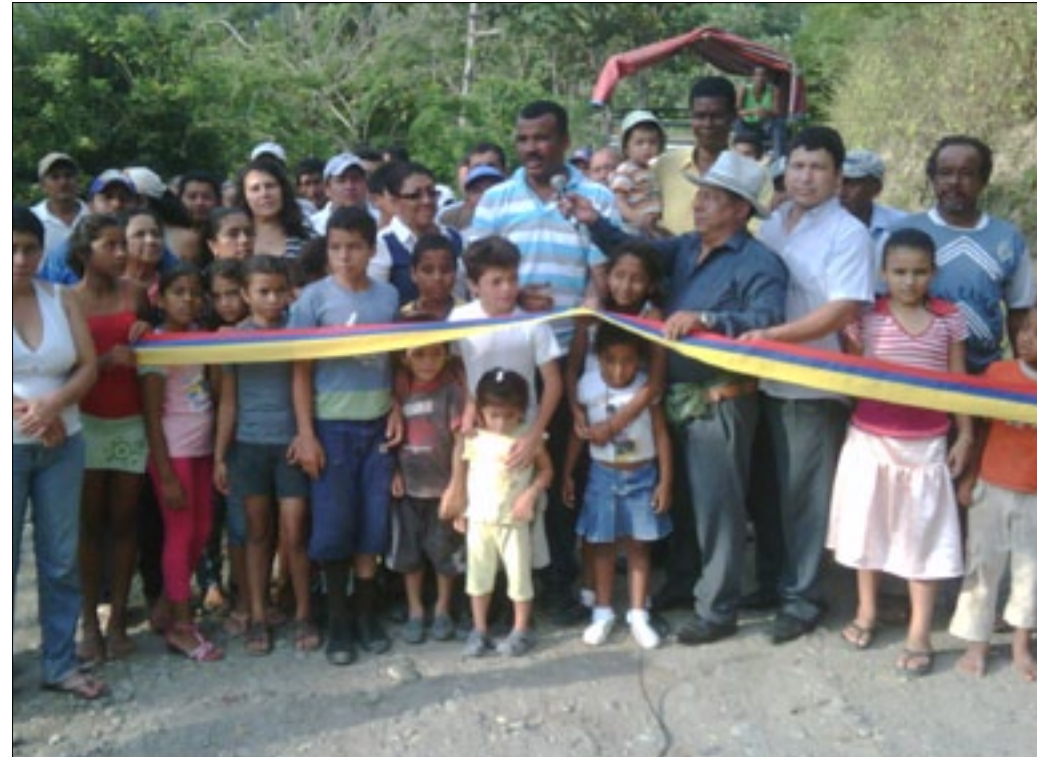
Moradores de Pircuta inaugurando la vía junto al Prefecto, el sábado 31 de agosto

Los habitantes de las comunidades pertenecientes a la Parroquia Cube en el cantón Quinindé ya disponen de una carretera lastrada en sus 7 Km, cuya obra fuera ejecutada por la Prefectura de Esmeraldas e inaugurada el pasado fin de semana, en