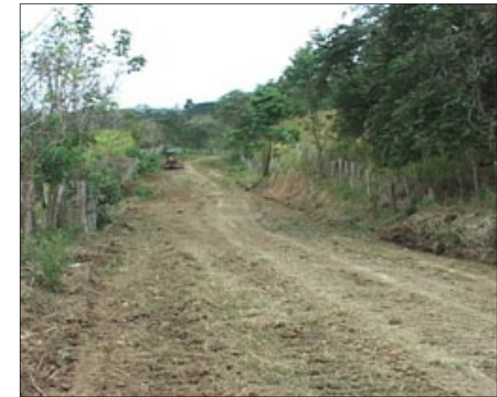
6KM. de camino piloto son aperturado por la Prefectura