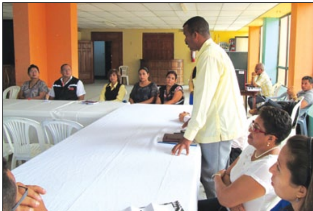
Empleados del GADPE y Prefecto participaron en taller de Participación Social

Con el propósito que los integrantes del Consejo de Participación Ciudadana y Control Social desde las diferentes instancias del sector público tengan un claro conocimiento desde el ámbito jurídico constitucional e histórico, al igual que los mecanismos de participación