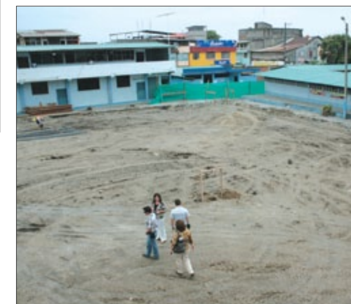
Área donde se construye minicoliseo

Finalmente el Prefecto Rafael Erazo reiteró el compromiso de continuar dignificando la educación de nuestra juventud y sobre todo continuar entregando sus esfuerzos para responder con hechos a la confianza del pueblo, que durante décadas anhelaba cambios positivos que hoy los experimenta la provincia en cada comunidad, gracias a la labor cumplida desde la Prefectura de la Provincia.