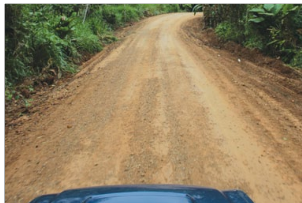
Vía Bolívar en Muisne mejorada por la Prefectura de Esmeraldas

Maquinarias y personal de la Prefectura de Esmeraldas, brindaron mantenimiento a los 4.5 kilómetros que comprende el tramo vial Troncal-Bolívar, comunidad turística que pertenece al cantón Muisne. Por varias ocasiones durante las administraciones lideradas por el Movimiento Popular Democrático al frente de la Prefectura Provincial, han brindado el apoyo respectivo para mejorar las condiciones de ingreso, pasando por predios camaroneros hasta llegar al sector donde separa un brazo de mar, con la Parroquia Bolívar.