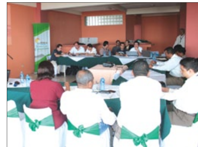
Durante dos días trabajaron en Esmeraldas los integrantes de las provincias mancomunadas

la restauración y conservación ambiental de los ecosistemas estratégicos en el norte del país; en Movilidad Humana el plan para el ejercicio pleno de los derechos de las personas en contextos de movilidad humana; en desarrollo turístico el diseño de las rutas turísticas de la mancomunidad; en certificación agrícola la certificación de plantaciones cacaoteras y cafeteras; y finalmente el modelo territorial la concepción y formulación del modelo prospectivo territorial