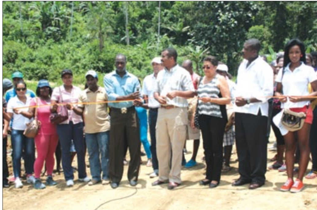
Prefectos y moradores de Wimbi inaugurando la vía el 21 de septiembre

En un importante acto desarrollado a 160 KM. de la capital provincial de Esmeraldas en la población de Wimbitico, Rafael Erazo Reasco, Prefecto de Esmeraldas, junto a la Viceprefecta Náyade Angulo