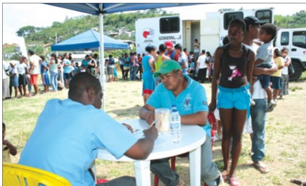
Habitantes del barrio 4 de Abril fueron beneficiados con brigada médica

Como estaba previsto el Patronato de Ayuda Social adscrito a la Prefectura de Esmeraldas desarrolló el pasado sábado 31 de agosto una jornada de salud