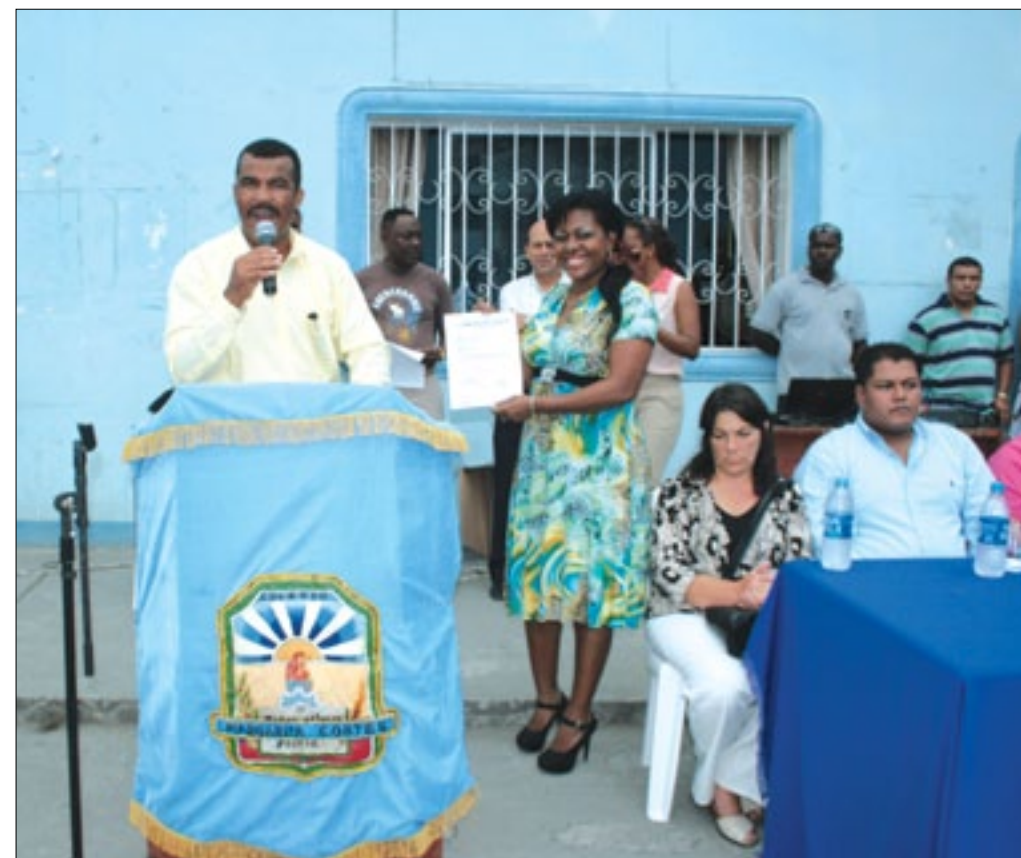
Prefecto entregando certificado del anticipo económico a la rectora del plantel

En acto desarrollado la mañana del viernes 20 de septiembre, las autoridades de la Prefectura de Esmeraldas, procedieron a realizar la entrega del 50% de anticipo, para el inicio de los trabajos de construcción del coliseo multiuso en favor del Colegio Nacional Mixto Margarita Cortés; para la ejecución de