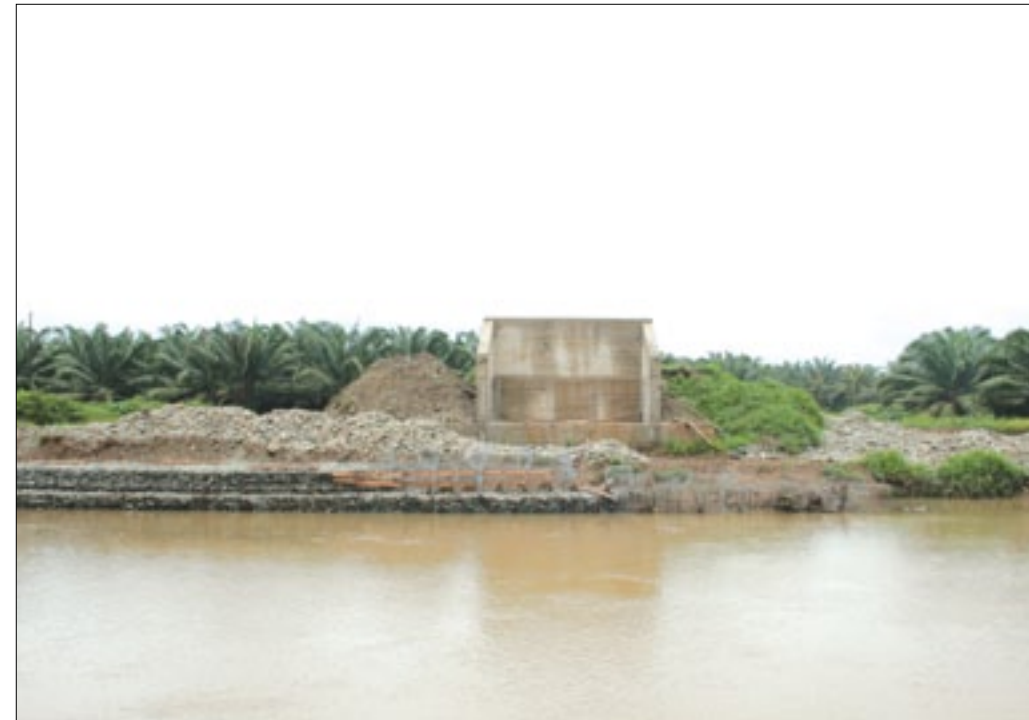
Río Bogotá sobre el cual se construye el puente de 82M