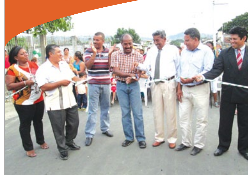
Autoridades de la Prefectura y Municipio de Esmeraldas inaugurando la obra