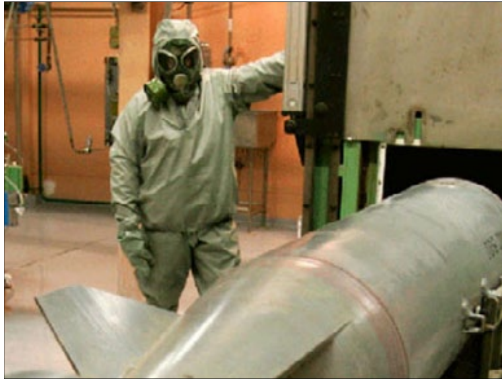
Armas químicas como Sarín y Mostaza serán destruidas según la ONU

La Organización para la Prohibición de Armas Químicas (OPAQ) informó el domingo 29 de septiembre que a partir del martes 1 de octubre, un equipo de veinte inspectores del