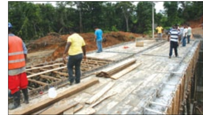
Puente sobre estero Achote-San Lorenzo

millones de dólares, por lo que se espera que la obra esté lista para su inauguración el próximo 16 de noviembre fecha que coincide con la celebración de los 209 años de fundación de la comunidad.