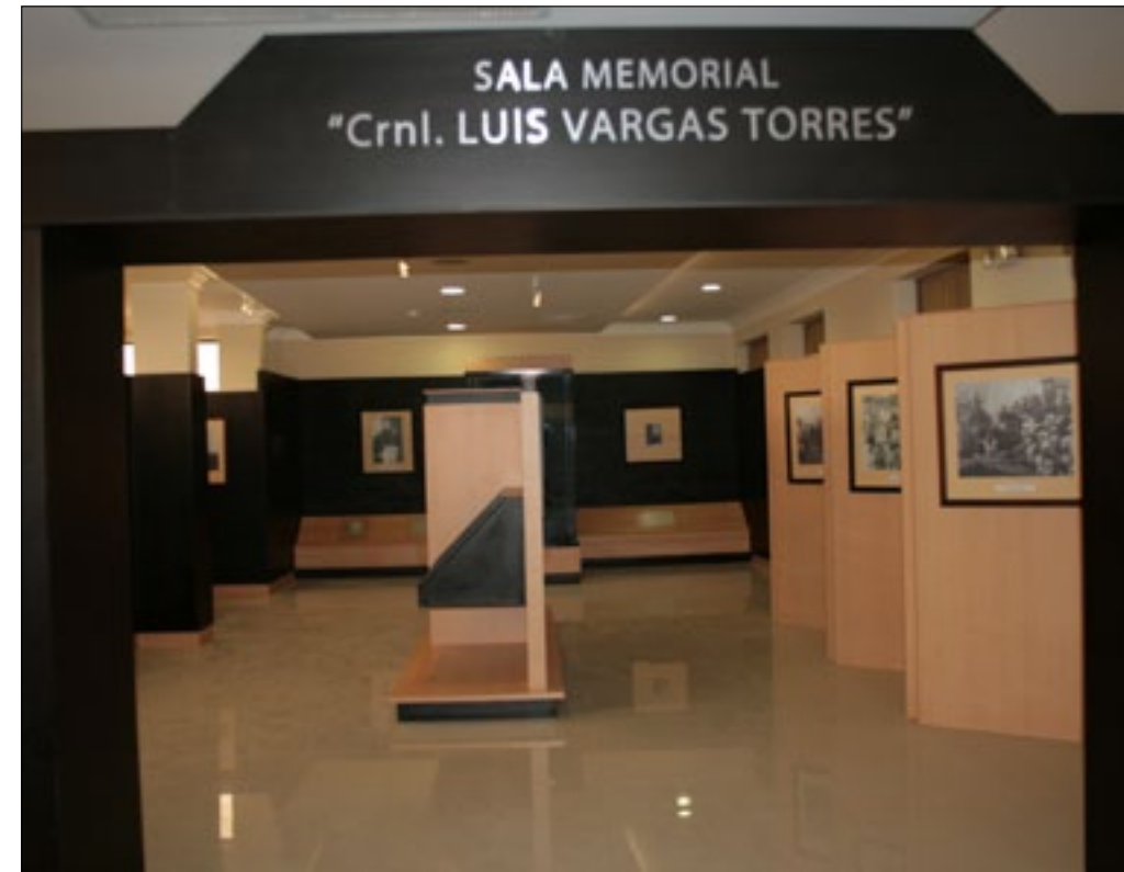
Sala memorial en homenaje al Crnl. Luis Vargas Torres inaugurada el 11 de septiembre

Con el propósito de perennizar la imagen señera del coronel Luis Vargas Torres, la mañana del miércoles 20 de septiembre se procedió a la inauguración de sala memorial en honor al héroe esmeraldeño, donde estará a la disposición del público imágenes, cartas, prendas u objetos que en su