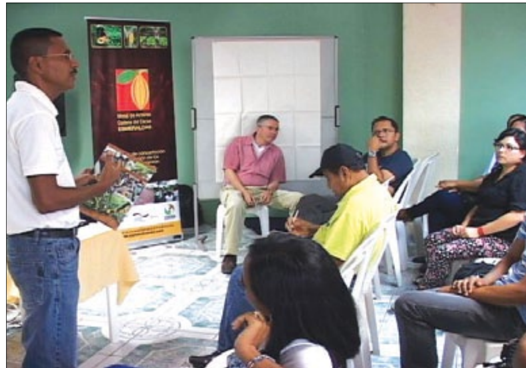
Técnicos de la Prefectura socializan proyectos a implementarse

Contando con la presencia de agricultores, productores y representantes de organizaciones de la Mesa Provincial de Cacao en Esmeraldas, se desarrolló la socialización sobre los avances de los proyectos que impulsa la Prefectura de Esmeraldas y que beneficiarán a este importante sector productivo.