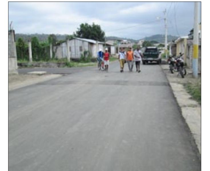
Asfaltado integral del barrio La Concordia-Esmeraldas

El acto inaugural contó con la presencia de decenas de familias del sector y además contó con presentaciones artísticas por parte de los grupos de marimba África Negra y Marimba y Clarinete, quienes pusieron a bailar a los presentes