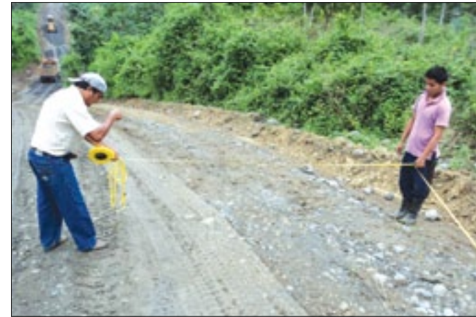
7km de vía lastrada por la Prefectura de Esmeraldas