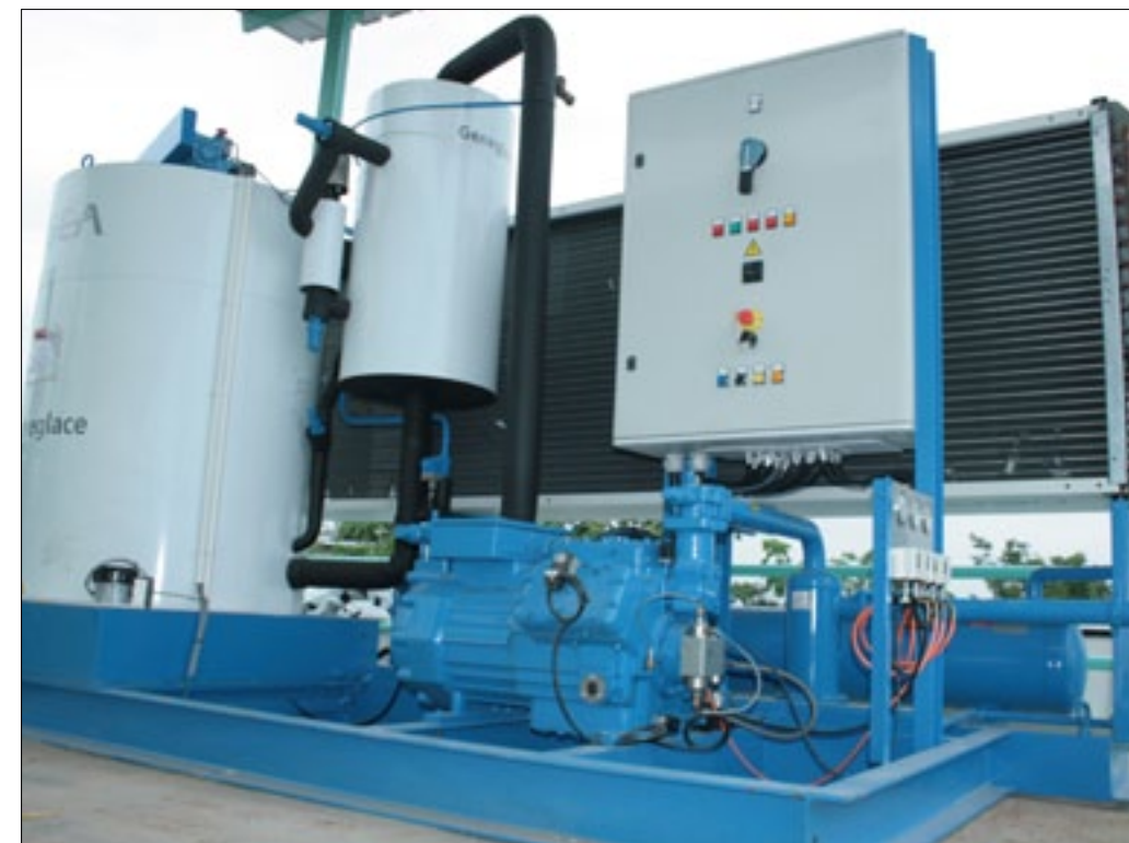
Modernos equipos para la fábrica de hielo

Serán 251 socios directos y más 1004 indirectos integrados en las 10 cooperativas de producción pesquera artesanal agremiadas en UCOOPANE en el cantón San Lorenzo los beneficiados con la producción que genere esta moderna planta productora de hielo en escarcha y en marquetas, cuyo proyecto es financiado en asociación por parte de la Prefectura de Esmeraldas, Cooperación Técnica Belga, Programa de Desarrollo Rural del Norte, municipio de San Lorenzo y cooperativa de pescadores. Con la producción de esta fábrica cuya construcción