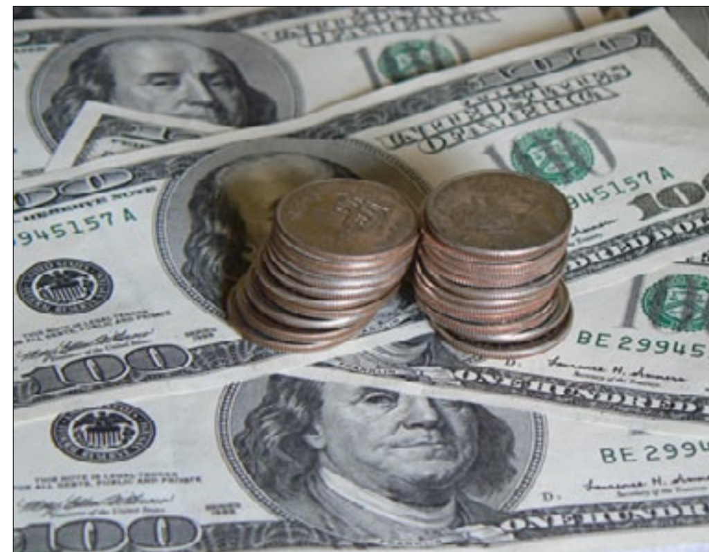
Se ha incrementado la deuda pública

La deuda ha crecido más que nunca, pero en un contexto en que el gobierno ha tenido tantos ingresos como en ninguna otra época. Lo cual es un cuestionamiento a la