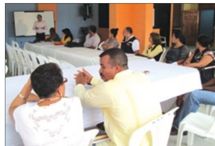
Expositor explica políticas en procesos de empoderamiento

Mientras tanto los participantes en el taller dijeron sentirse satisfechos por las orientaciones recibidas, lo que constituye un mecanismo que servirá para visibilizar y transparentar el accionar institucional, incorporando al elemento vivo como lo es ciudadano en los diferentes procesos para el fortalecimiento del sistema de participación ciudadana.