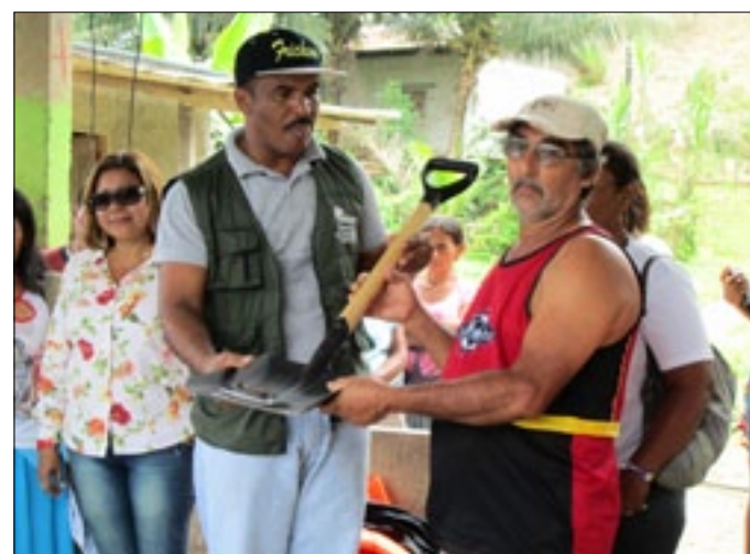
Campeño recibiendo herramientas