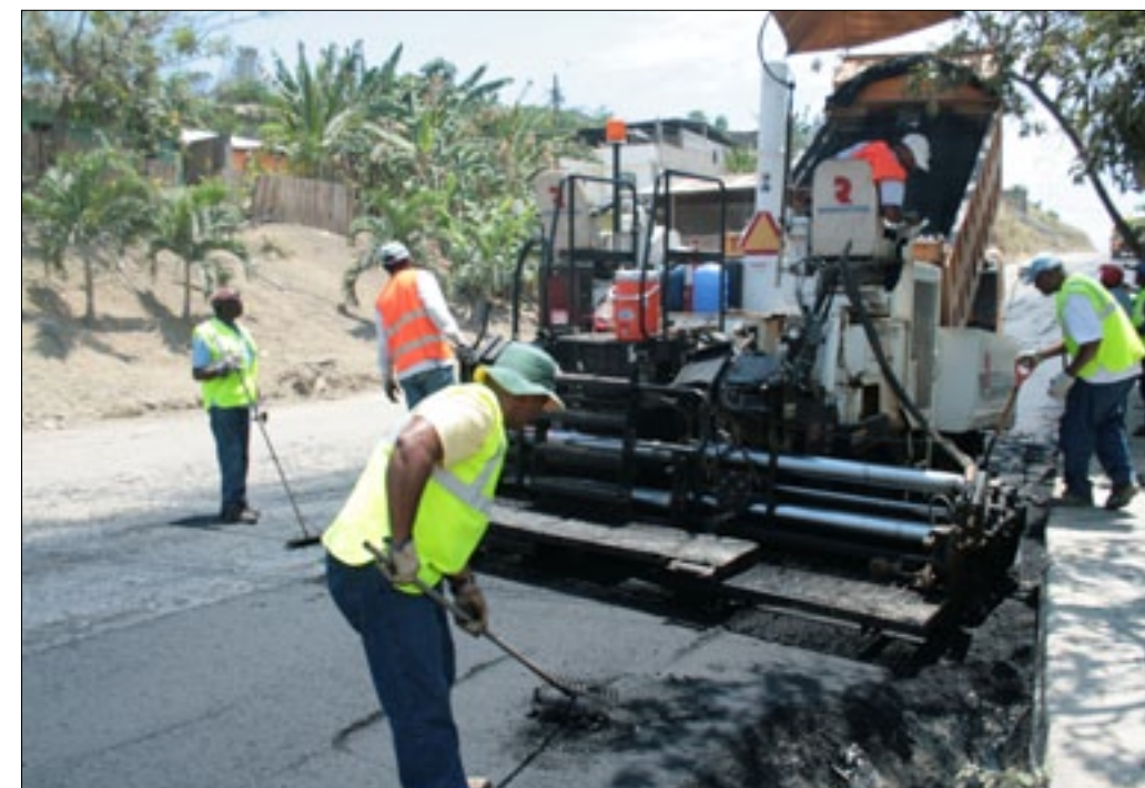
Obreros y maquinaria de la Prefectura en plena labor

En un recorrido efectuado en el sector del barrio San Martín de Porres bajo, lugar donde sus calles se presentaban totalmente intransitables, con enormes horámenes lo que hacía imposible el recorrido de las unidades de transporte público y los pocos que llegaban al sector lo hacían cobrando tarifas elevadas.