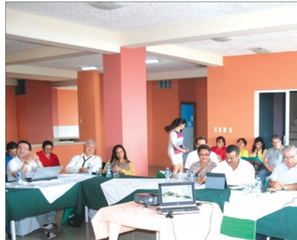
Prefectos y técnicos diseñando estrategias para beneficio de la Mancomunidad del Norte

A la ciudad Esmeraldas se dieron cita técnicos y autoridades de las prefecturas de las 4 provincias que integran la Mancomunidad del Norte, encuentro en el que durante el primer día se realizó un exhaustivo análisis de los procesos desarrollados