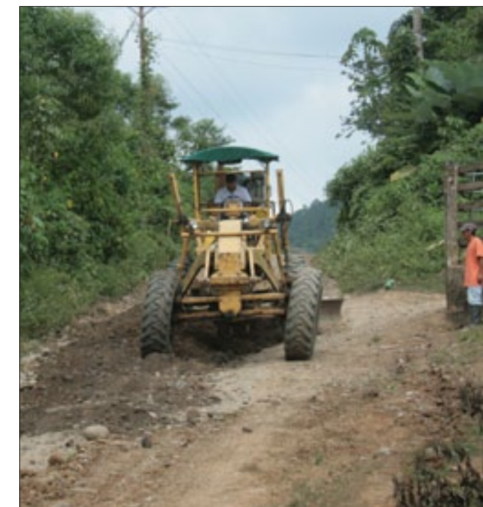
Vía Mirador La Juanita-Quinindé