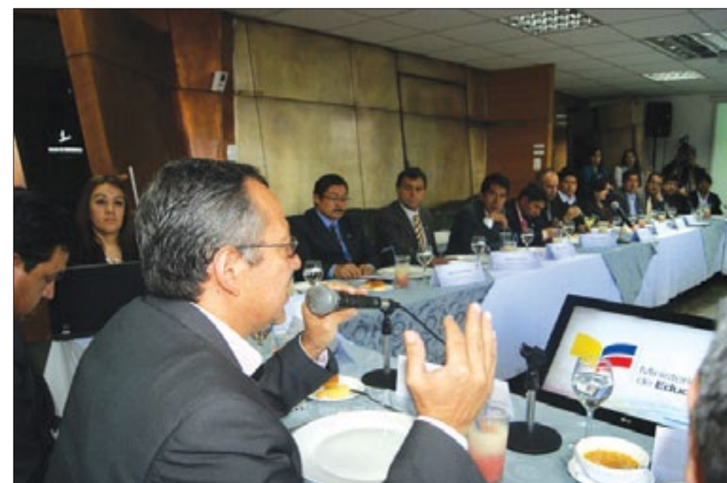
Ministero Gustavo Espinoza y alcaldes

Una propuesta del ministro de Educación, Augusto Espinoza,