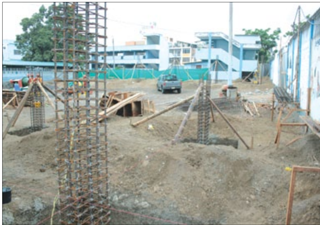
Fundición de grandes columnas para lo que será el coliseo

En el colegio Nacional Margarita Cortés de la ciudad Esmeraldas se cumple sin inconvenientes los trabajos para la construcción de un moderno coliseo multi- uso, que beneficia especialmente al estudiantado de este prestigioso establecimiento educativo. Luego de adecuar el área, se ha iniciado el sembrado de las columnas donde se levantará la estructura deportiva, con capacidad suficiente para dar albergue a quienes asistan al disfrute de las actividades a cumplirse en el mencionado