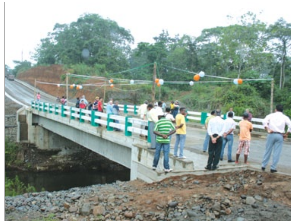
Puente sobre el río Sabalito-Malimpia-Quinindé

Un viejo anhelo esperado por más de 40 años, al fin pudo convertirse en realidad, gracias al apoyo de las autoridades de la Prefectura de Esmeraldas, entidad que construyera el puente de hormigón armado de 24 metros luz sobre el río Sabalito, perteneciente al cantón Quinindé.