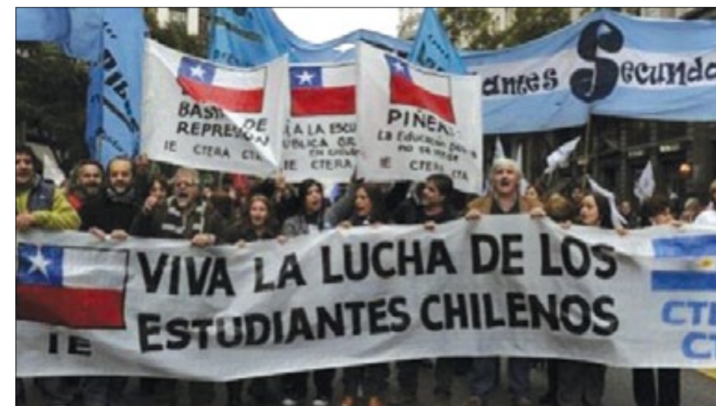
Estudiantes universitarios chilenos en exigencias por cambios en el sistema educativo

A un mes de que se realicen las elecciones presidenciales, los estudiantes universitarios y secundarios protagonizaron una nueva jornada de movilización nacional, en la que retaron a los candidatos a que se pronuncien sobre los temas de educación. Durante la marcha, la sexta del año, los estudiantes exigieron a los candidatos presidenciales a que, a un mes de las elecciones, entreguen detalles de sus propuestas en educación, y que incluyan a los movimientos sociales en la elaboración de estos