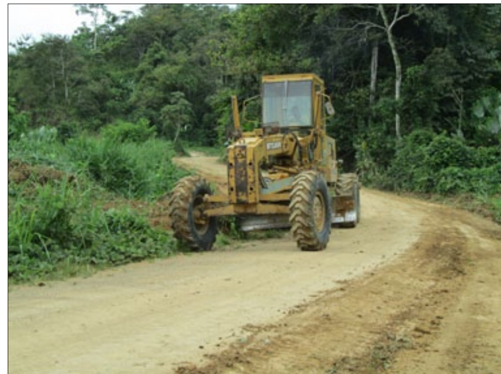
10 km. de carretera son intervenidos por la Prefectura de Esmeraldas

Ante la proximidad de la etapa invernal y cumpliendo con el programa de mantenimiento vial, la Prefectura de Esmeraldas realiza los trabajos