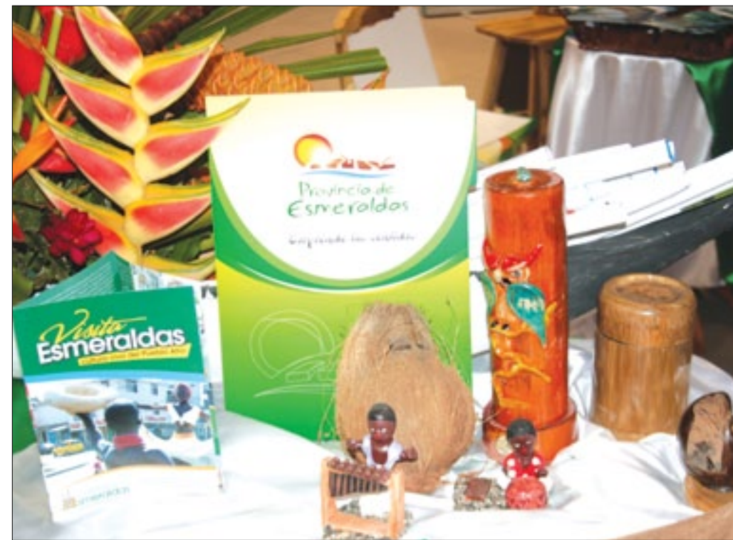
Esmeraldas presente en FITTE

El pasado 27 de septiembre en la ciudad de Guayaquil se realizó el acto del lanzamiento de la Marca "Esmeraldas Sorprende tus Sentidos" por parte de la Prefectura de Esmeraldas, donde participaron autoridades de la Prefectura del Guayas,