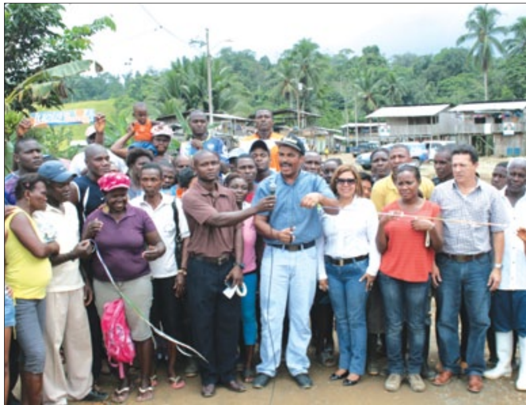
Los habitantes no quisieron perderse el instante en que se cortó la cinta de inauguración

Las poblaciones de Timbiré, Juan Montalvo, y "Aquí me Quedo" son beneficiadas con la construcción de una carretera lastrada en 10KM, construida por la Prefectura de Esmeraldas