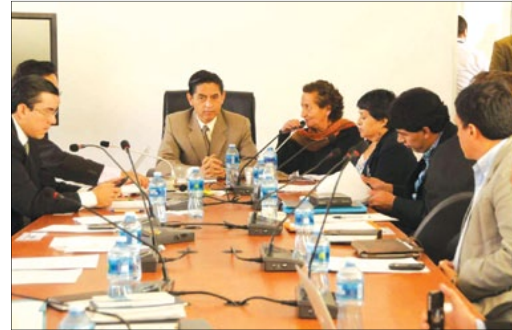
Debate del primer libro del Código Penal

El oficialismo apresura el paso para aprobar el Código Integral Penal, que responda a las necesidades políticas del correísmo y se convierta en un instrumento útil para el gobierno y su política de persecución. En estos días el oficialismo en la Asamblea Nacional se ha reunido sin descanso con la finalidad de aprobar rápidamente el Código Penal Integral. Esta premura ha sido, en una medida, justificada