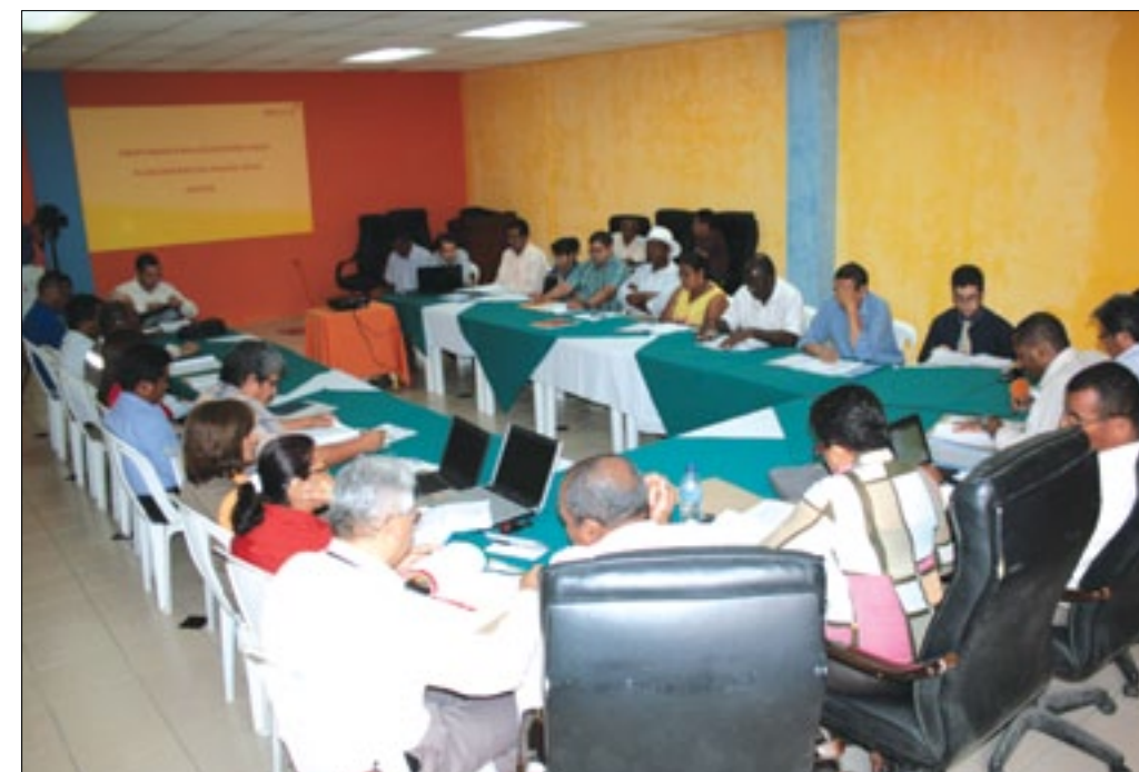
Miembros de Participación Ciudadana y las Comisiones de Desarrollo Territorial, Finanzas y Presupuesto Participativo y la Comisión de Gobernabilidad y Asuntos Institucionales

En sesión ordinaria del Sistema de Participación Ciudadana y Control Social, el pleno de este organismo se reunió para oficializar a los miembros de las comisiones de Planificación y Desarrollo Territorial; Finanzas y Presupuesto Participativo y la Comisión de Gobernabilidad y Asuntos Institucionales.