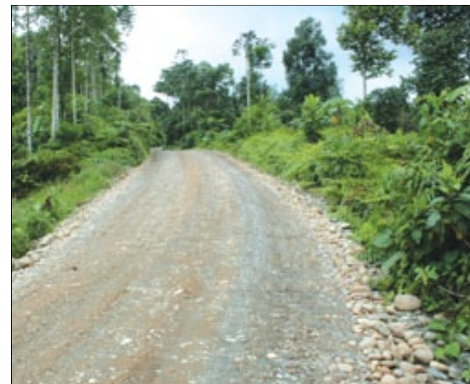
Vía Juan Montalvo-"Aquí me Quedo" lastrada en 10 km