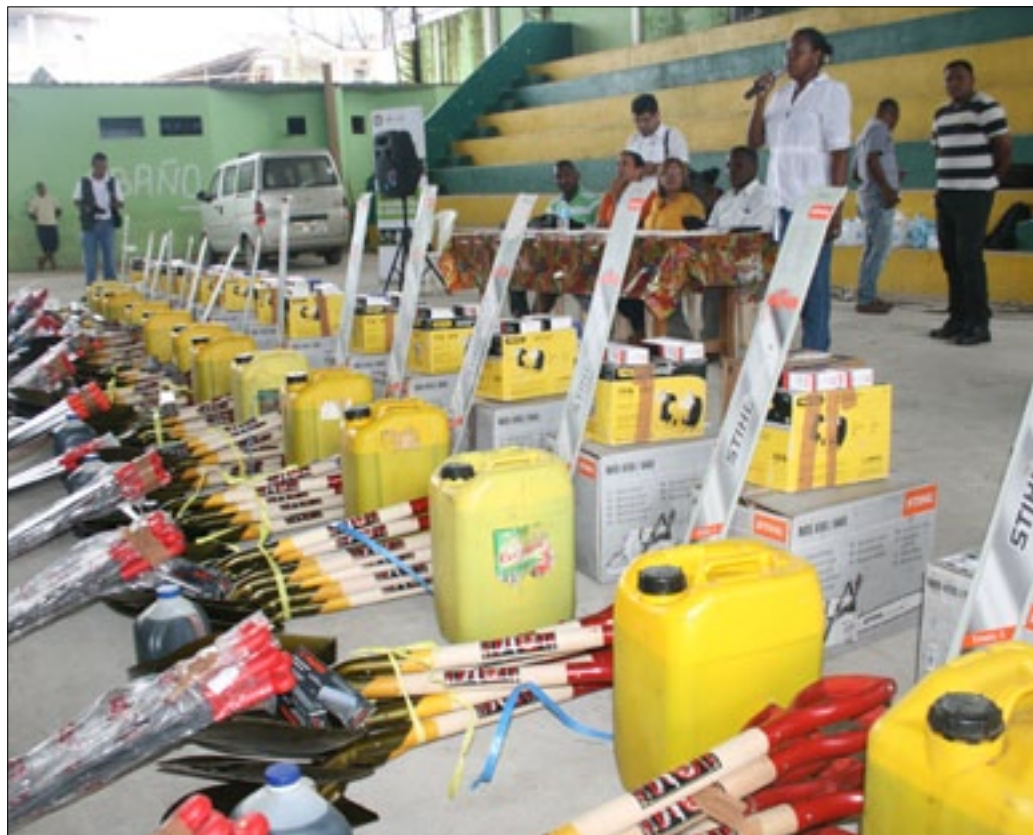
Herramientas entregadas a productores del cantón Eloy Alfaro, dentro del proyecto de soberanía alimentaria

En el marco de las políticas públicas para el ejercicio de la competencia de fomento en las actividades productivas y agropecuarias que la Constitución y la ley del COOTAD asignan a los gobiernos autónomos descentralizados provinciales; la Prefectura de Esmeraldas ha aplicado el plan participativo de desarrollo Productivo de la Provincia.