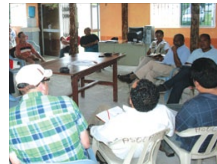
Los delegados de las instituciones acordaron realizar nuevas reuniones

Entre las resoluciones de la reunión de trabajo se acordó que el Ministro del MAGAP junto al Ministerio del SENAGUA con la Prefectura de Esmeraldas, mantengan una nueva reunión de trabajo para cristalizar la parte económica y beneficiar a los campesinos del cantón Rioverde.