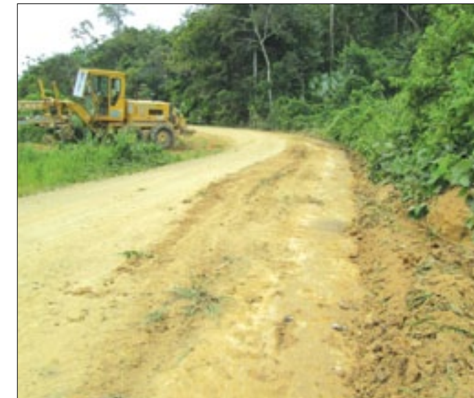
Se efectúan labores de ensanchamiento y resanteo

las aguas represadas en ambos lados, al tratarse de una zona pantanosa. De esta manera el equipo técnico y obreros de la Prefectura intensifican los esfuerzos por mantener expeditas las vías en beneficio de las comunidades campesinas en toda la provincia.