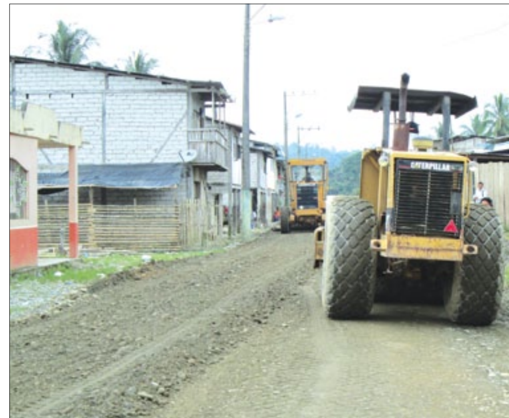
Calle de acceso a la población de Selva Alegre-Eloy Alfaro

Tal cual fue el compromiso de las autoridades de la Prefectura de Esmeraldas una vez que parcialmente se han alejado las lluvias inmediatamente se ha intervenido en los trabajos