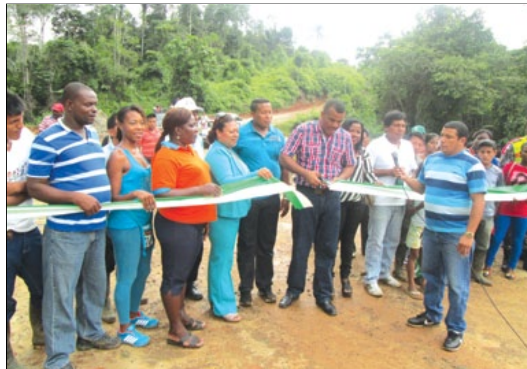
Prefecto junto a los pobladores inaugurando el puente

SOLO ESTA PREFECTURA SE ATREVIÓ HACER LO QUE NADIE HIZO