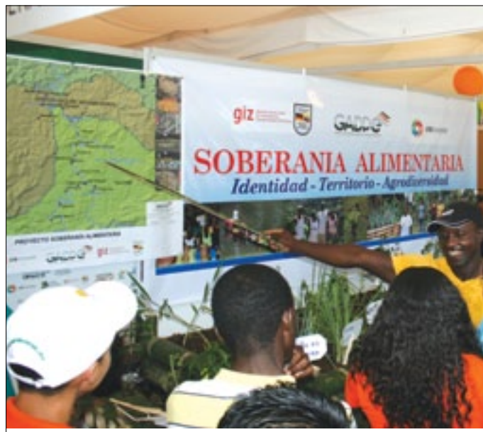
Exposición de la feria productiva 2012

Continúan desarrollándose importantes gestiones para que varias empresas del país, formen parte de la Tercera Feria Productiva 2013 evento organizado por la Prefectura de Esmeraldas, actividad que busca apoyar a las cadenas productivas con que cuenta la provincia de Esmeraldas. Para el presente año se cambiará la posición de los stands con la finalidad de mejorar el tránsito peatonal en el área comprendida al interior de la Plaza Cívica Nelson