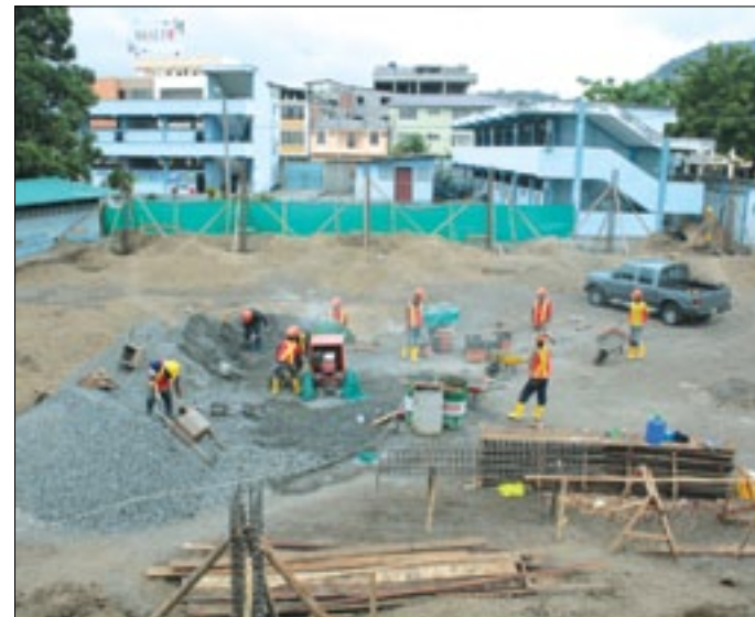
Obreros en plena labor

aporte no solo para los estudiantes quienes hasta ahora están obligados a cumplir los ejercicios de cultura física en estas condiciones, expuestos a la lluvia o al candente sol; sino también el hecho que Esmeraldas dispondrá de un local en pleno casco central para el desarrollo de actividades de tipo social.