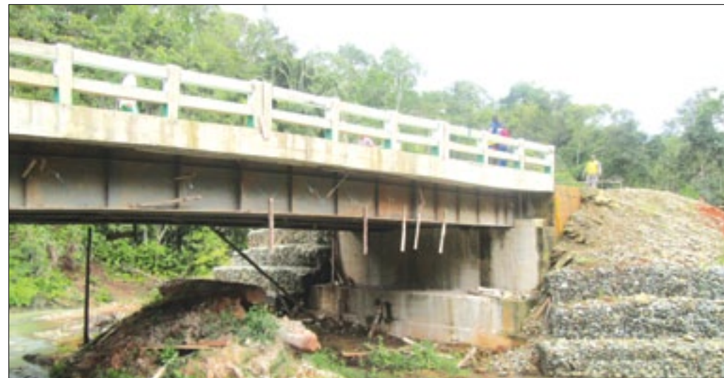
Puente sobre el río Sabalera, una obra para más de 40 años de servicio