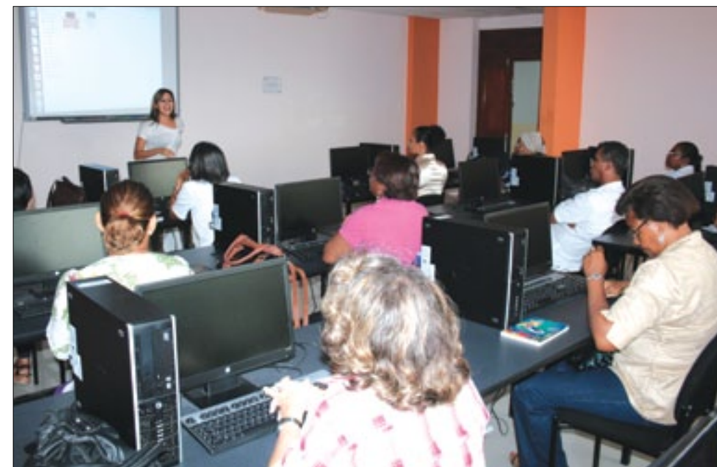
Adultos mayores son capacitados en uso de tecnología

A través de la área de Tecnologías de la Información y Comunicación de la