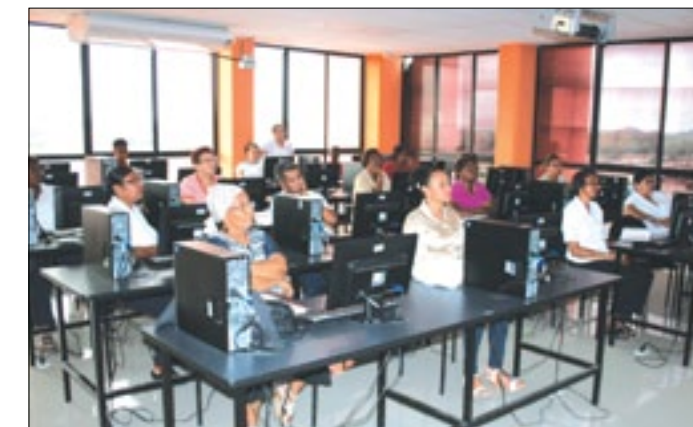
Aula virtual de la Prefectura de Esmeraldas

redes sociales. Estamos contentos por las clases recibidas, no podemos quedarnos en el pasado, debemos actualizar nuestros conocimientos para poder interactuar con nuestros familiares, dijo uno de los socios presentes en el aula virtual de la Prefectura de Esmeraldas.