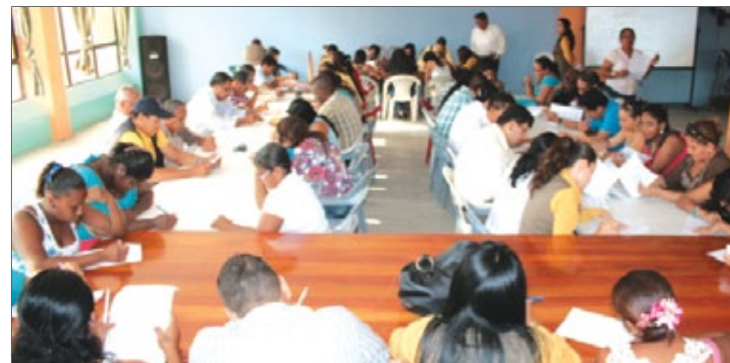
Postulantes a ocupar vacantes rindiendo pruebas de conocimientos y psicotécnicas