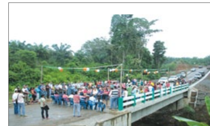
Los comuneros presentes en la inauguración del puente

Con una inversión que supera los 277 mil dólares la Prefectura de Esmeraldas levantó esta infraestructura de 24 metros luz sobre el río Sabalito, obra de gran importancia que beneficia a centenares de familias campesinas asentadas en comunidades pertenecientes a la parroquia Malimpia en el cantón Quinindé