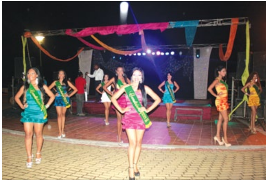
Las candidatas en sus recorridos por los diferentes cantones

Diversas son las actividades que el comité de fiestas de provincialización tienen previsto desarrollar del 4 al 20 de noviembre. Feria productiva, concurso de oratoria, exposiciones fotográficas, fétival de música rokokera, concurso de bandas juveniles, festival de la salsa, elección de la reina y niña provincialización; son entre otras las actividades que se encuentran agendadas para el deleite de los esmeraldeños. Al momento se trabaja en la preparación de 9 hermosas jovencitas buscan coronarse como la mujer más bella de la provincia de Esmeraldas, evento galante que forma parte de las actividades a desarrollarse por los 166 años de Fundación de Provincialización de Esmeraldas. Para ello hay 5 representantes por el cantón Esmeraldas