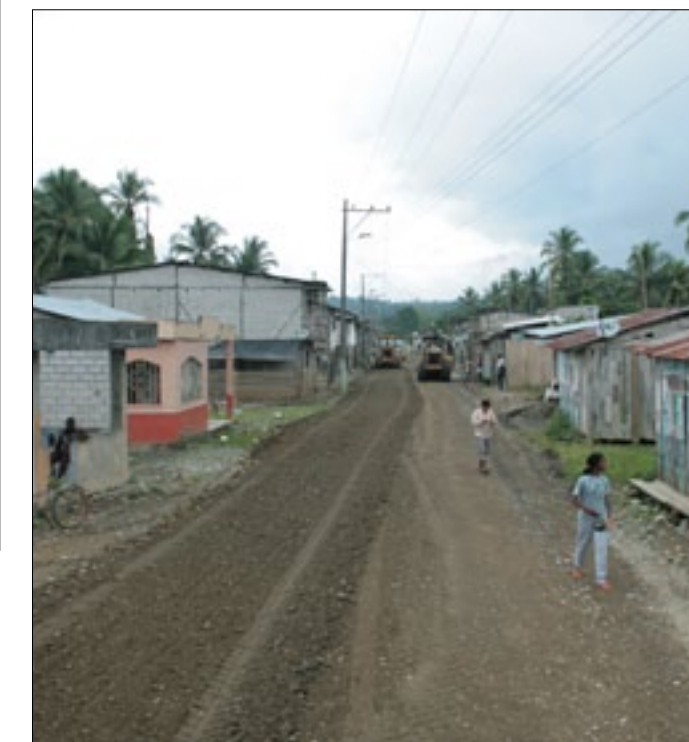
Trabajos previos a la colocación de carpeta asfáltica

trimestre del presente año. Una vez cumplida la fase de lastrado y compactación de la vía en los próximos días se procederá al desplazamiento de las maquinarias para proceder con la imprimación y tendido de la carpeta asfáltica.