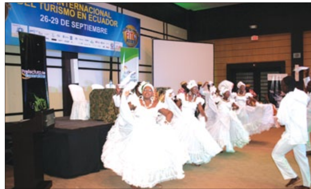
África Negra deleitó a los visitantes de la feria