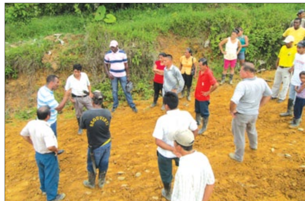
Prefecto y comuneros constataron la situación de la vía

Las lluvias presentadas en las últimas semanas en la provincia ha ocasionado