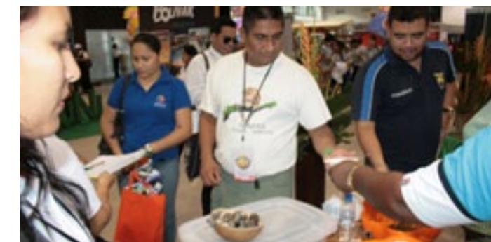
Los visitantes degustaron los platos típicos esmeraldeños

gastronomía, causando impacto entre quienes visitaban el stand de los esmeraldeños. En el marco musical, se presentó el Grupo de Música Folclórica África Negra, quienes bailaron para el deleite de los asistentes a la Feria Turística Internacional.