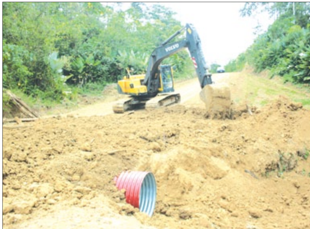
Vía Chumundé-Meribe recibe mejoramiento y se colocan alcantarillas

PREFECTURA DE ESMERALDAS INTERVIENE VÍA CHUMUNDÉ-MERIBE