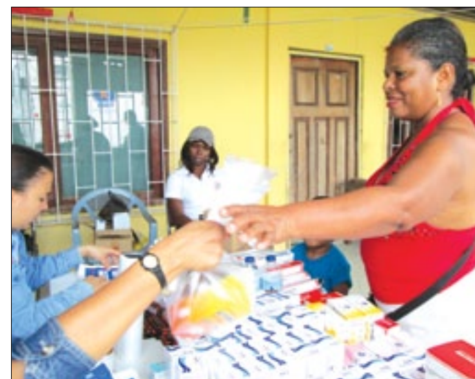
Como es la política del Patronato la medicina es gratuita

vulnerables de la provincia De esta manera la Prefectura de Esmeraldas a través del Patronato provincial cumple con los esmeraldeños al llegar a sus comunidades con actividades médicas que les permita atenderse de manera preventiva y gratuita