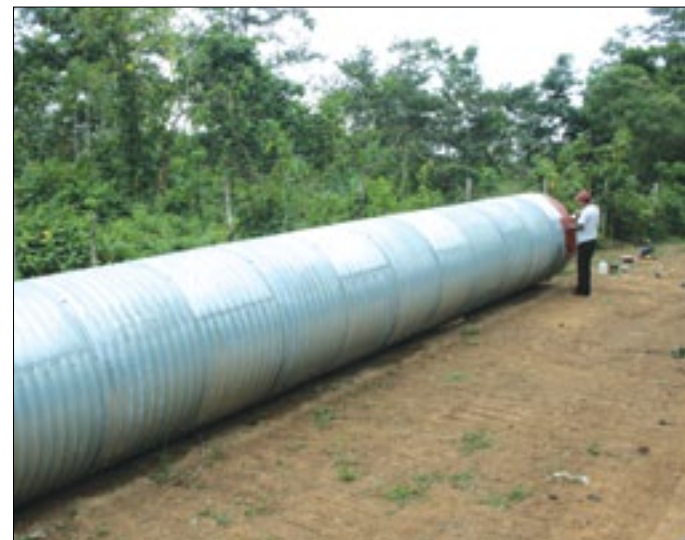
En varios tramos de la vía se colocan alcantarillas

anterioridad. Vale recordar que son varias las ocasiones que desde la Prefectura Provincial de Esmeraldas, se ha colaborado con la vía Chumundé-Meribe, abriendo el camino piloto y hoy dándole el mantenimiento respectivo así como colocándole las respectivas alcantarillas, lo indicó uno de los funcionarios de la entidad provincial.