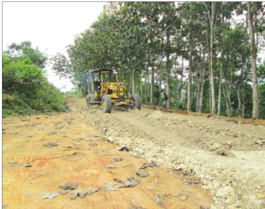
Maquinaria efectúa labores de cascoteo en la vía Hoja Blanca-San Francisco del Ónzole