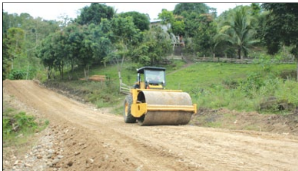
Maquinaria de Prefectura realizando lastrado de la vía Lagarto-Pajuí