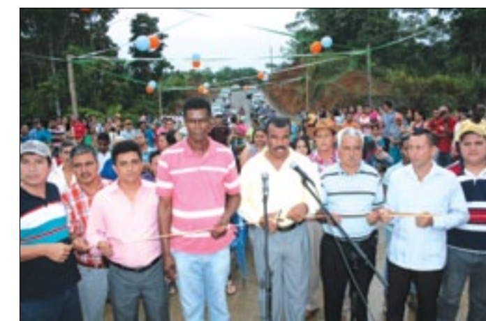
Autoridades y comunidad en el corte de cinta