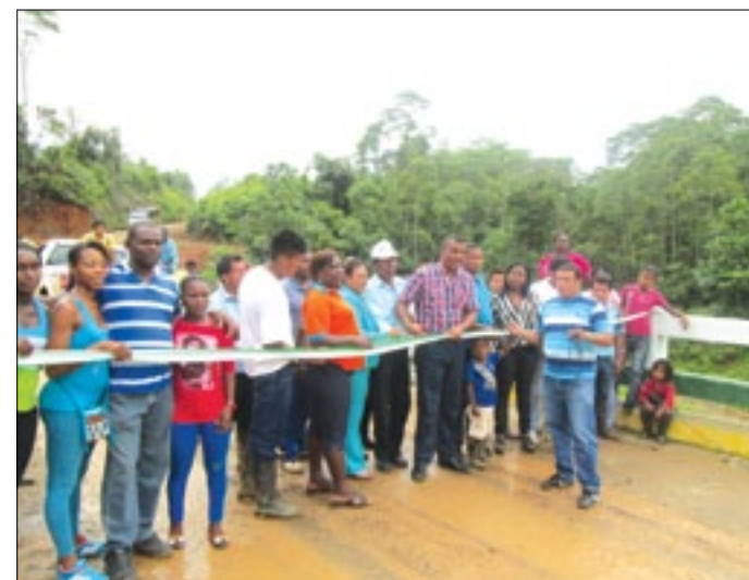
Pobladores y Prefecto en el corte de cinta que da por inaugurado el puente sobre el río Achioté

276.008 USD Es el costo del puente sobre el río Sabalera