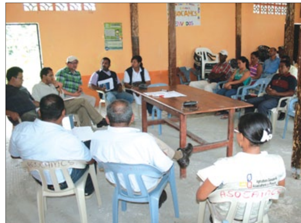
Delegados analizan la creación de un Sistema de Riego Parcelario

En las instalaciones de la Asociación de Campesinos Autónomos de las comunidades de Mediana-Cabuyal-Sandoval del cantón Rioverde, ASOCAMCS, arribaron representantes de la Subsecretaria de Riego del MAGAP, SENAGUA y de