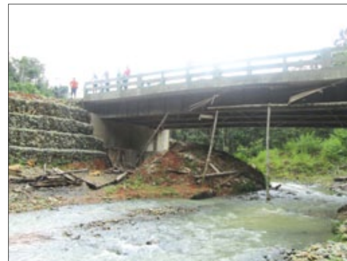
Puente sobre el estero Achioté-San Lorenzo

Decenas de comunidades pertenecientes al cantón San Lorenzo son beneficiadas con la construcción de dos puentes sobre los ríos Sabalera y Achioté respectivamente, para la construcción del puente sobre el río Sabalera se realizó la inversión de USD 276.008,77; mientras que el puente sobre el río Achioté tuvo un costo de USD 122,434,42.