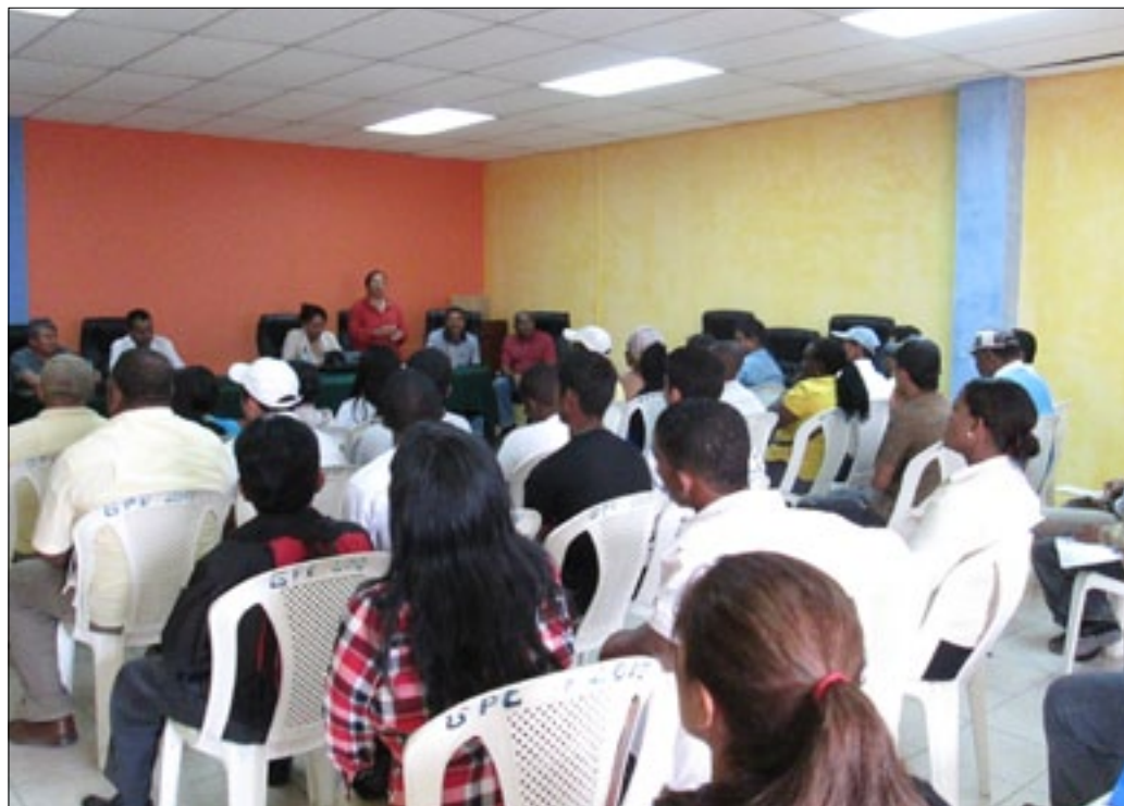
30 nuevos líderes ambientales fueron graduados en la tercera promoción

La Prefectura de Esmeraldas con el apoyo y asesoría de la Cooperación Alemana GIZ, la