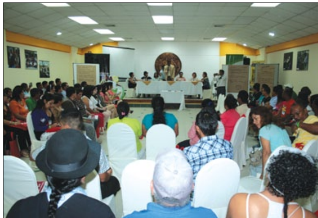
Delegaciones de Napo, Orellana, Tungurahua, Zamora Chinchipe y la anfitriona Esmeraldas se dieron cita a este encuentro de género

Atacames fue el escenario donde representantes de Esmeraldas, Napo, Orellana, Tungurahua y Zamora Chinchipe se reunieron en un gran encuentro nacional