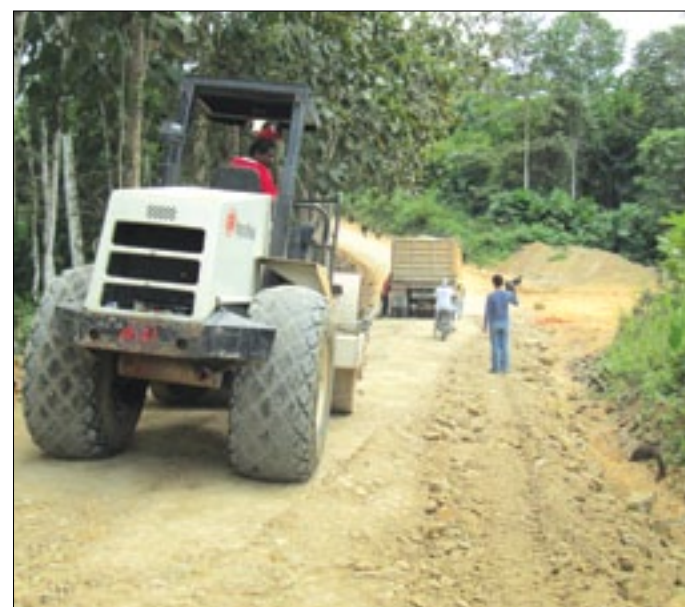
Obreros aceleran trabajos viales