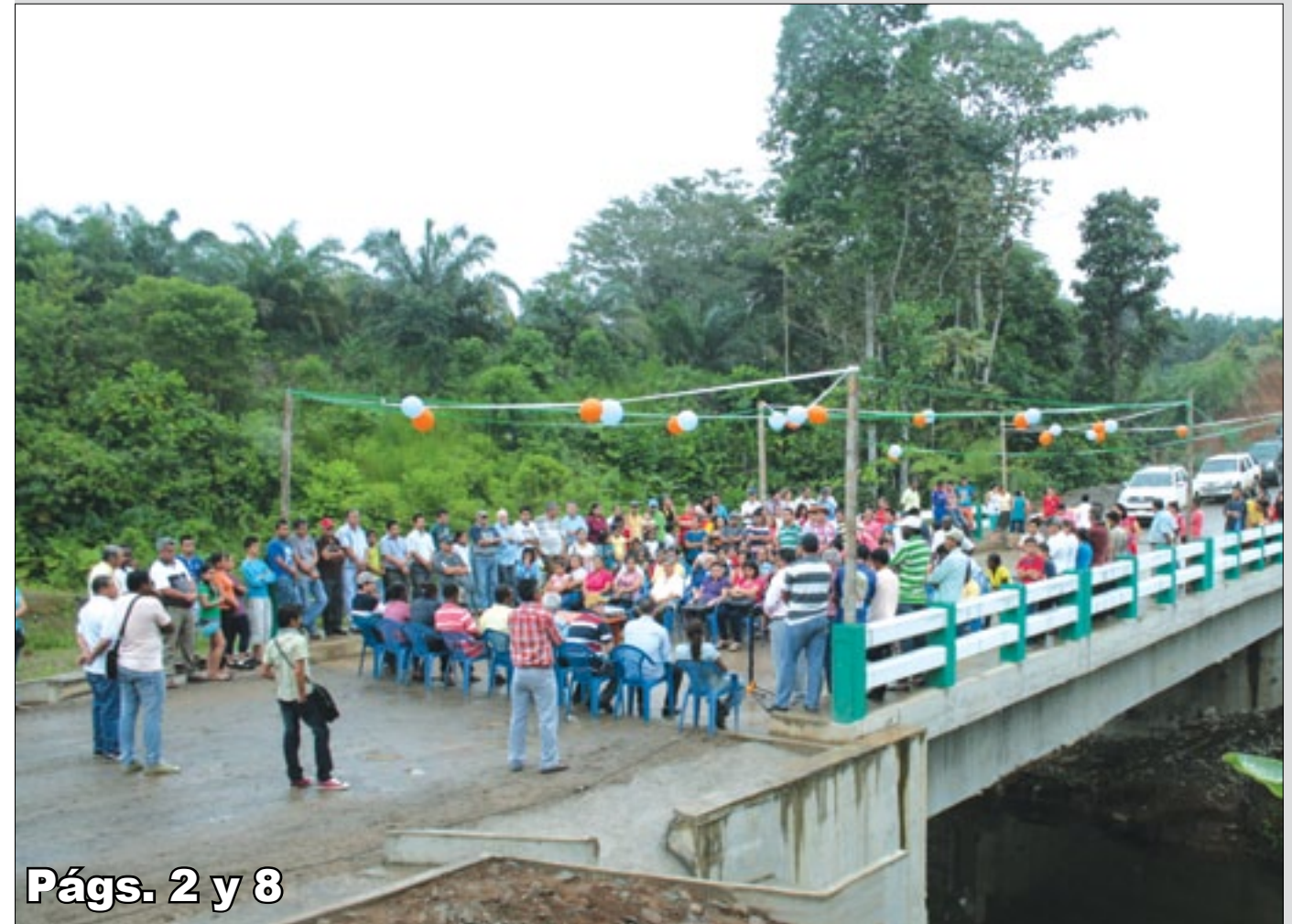
Págs. 2 y 8

Con una inversión que supera los 277 mil dólares la Prefectura de Esmeraldas levantó esta infraestructura de 24 metros luz sobre el río Sabalito, obra de gran importancia que beneficia a centenaes de familias campesinas asentadas en comunidades pertenecientes a la parroquia Malimpia en el cantón Quinindé, en tanto que para la construcción del puente sobre el río Sabalera se realizó la inversión de USD 276.008,77; mientras que el puente sobre el río Achiote tuvo un costo de USD 122,434,42 estos dos últimos en el cantón San Lorenzo.