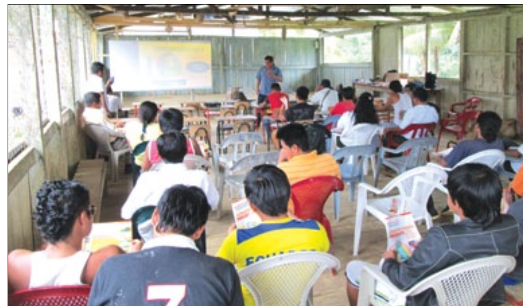
Participantes de la escuela de liderazgo social en Telemnbi-Eloy Alfaro

El martes 15 y miércoles 16 del presente en el Coliseo Arcesio Ortiz Estupiñán de la población de Telembi, cantón Eloy Alfaro, se realizó un taller y el inicio de la Escuela de Liderazgo Social con Visión Intercultural por parte de la Secretaria Técnica de Participación Ciudadana de la Prefectura Provincial de Esmeraldas.