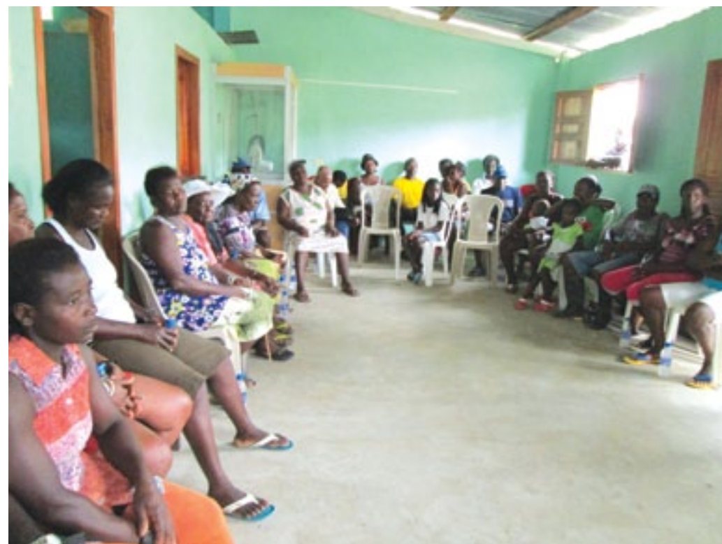
Habitantes de Mútiles en reunión de trabajo con autoridades de Municipio y Prefectura