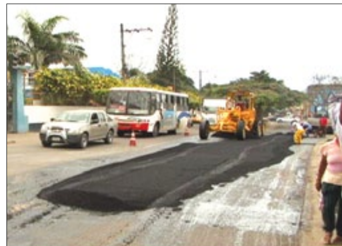
La ciudadanía espera que la EAPA no vuelva a destruir las calles