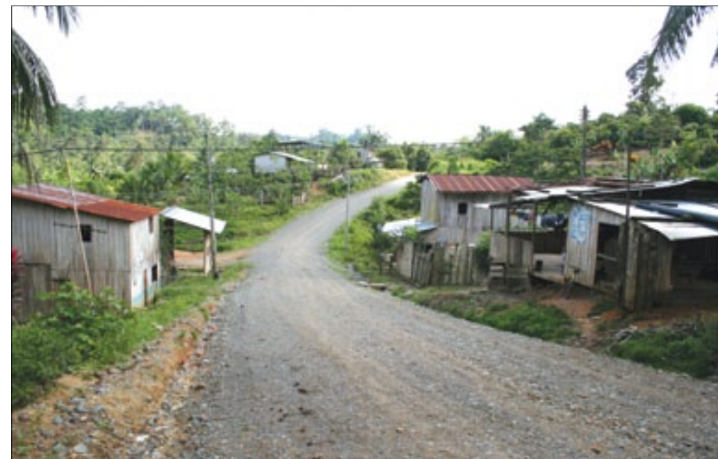
Comunidad Mata de Plátano beneficiada con el mejoramiento de la vía

14 km. De carreteras fueron intervenidos por la Prefectura de Esmeraldas en el tramo Mata de Plátano-El Ceibo-Limoncito pertenecientes al cantón Eloy Alfaro, para es de señalar que estos trabajos corresponden a tareas de mantenimiento ya que las lluvias caídas en la zona en el pasado invierno deterioraron importantes tramos de esta vía así como varias alcantarillas.