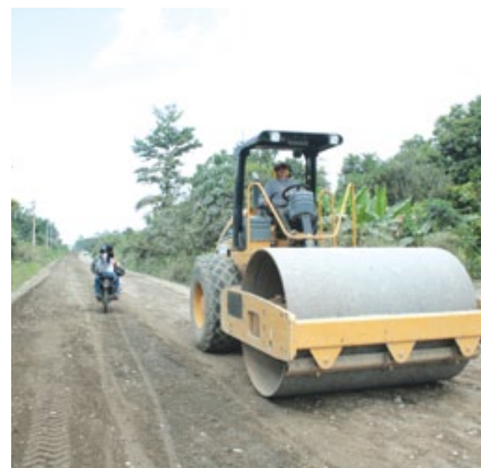
Previo al asfaltado se efectuó el cambio de suelo

de vía está asfaltando la Prefectura en la vía Unión el Silencio - Quinindé