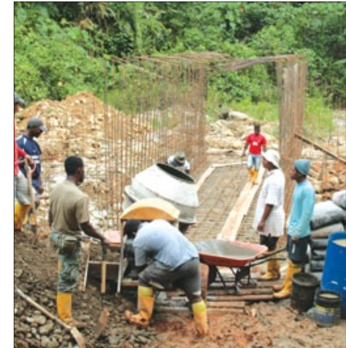
Obreros construyendo un ducto cajón

De acuerdo al informe emitido por los técnicos de la Prefectura, los trabajos de lastrado de la carretera estarían concluidos hasta mediados de septiembre, listos para su inmediata inauguración.