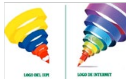
Primer diseño de logo del IEPI

primer logotipo presentado por la agencia Maxtimsa, con una ilustración de venta por Internet, ofertado por la empresa Canstockphoto. El pasado 16 de mayo, Andrés Ycaza, director del IEPI, dispuso un plazo de 10 días hábiles a Maxtimsa para que presentara nuevas propuestas gráficas. Pero las propuestas fueron rechazadas y se declaró el concurso desierto para reiniciar de cero con el rediseño. La primera semana