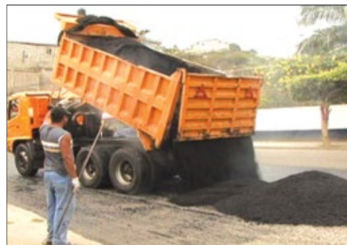
El bacheo también se lo hará en las Tolitas 1 y 2