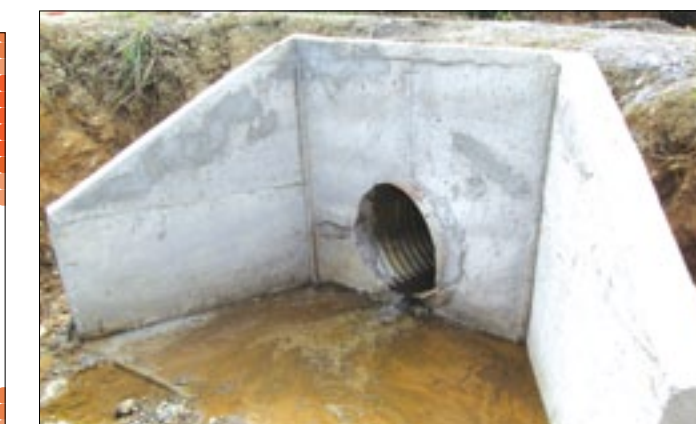
Varias alcantarillas se han colocados en esta vía

La permanente presencia de lluvias en la zona alta del Cantón Quinindé, ha contribuido al deterioro de los caminos vecinales, así como también al colapso de varias alcantarillas, obstaculizando el tráfico vehicular, como viene sucediendo en la vía Mirador-Unión Manabita, perteneciente al cantón Quinindé. Maquinaria contratada por la Prefectura de Esmeraldas, realiza trabajos de colocación de alcantarillas metálicas para que pueda evacuar el agua estancada en los sitios donde se presentan estas emergencias viales que dificultan la movilidad de los habitantes del Recinto Unión Manabita. Vale destacar que las autoridades de la entidad provincial, siguen atendiendo todas las emergencias que se presenten en los caminos vecinales, de acuerdo al presupuesto económico que tiene la corporación de desarrollo provincial.