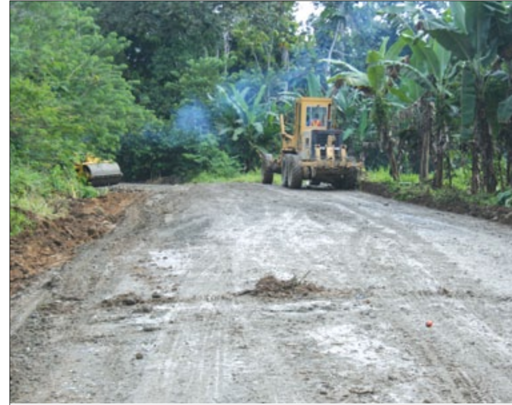
Maquinaria en labores de lastrado de la vía

Pese a la inestabilidad del clima en la zona, los obreros de la Prefectura de Esmeraldas redoblan esfuerzos con la finalidad de culminar hasta finales del presente mes, los trabajos de lastrado que se vienen