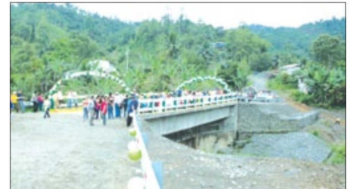
Puente sobre el río Májua

US$ 161.846 Es la inversión que efectuó la Prefectura de Esmeraldas para la ejecución de esta puente