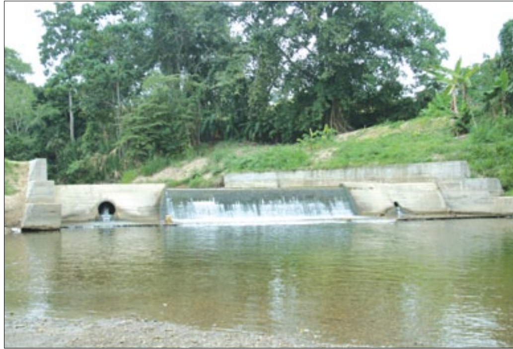
Tape ubicado en el recinto Altamira en el cantón Rioverde

La Prefectura de Esmeraldas, a través de Riego y Drenajes de la Dirección de Gestión Ambiental, viene desarrollando el mantenimiento en los sistemas de tapes o represas en varios sectores del cantón Rioverde, precisamente en los recintos Altamira y