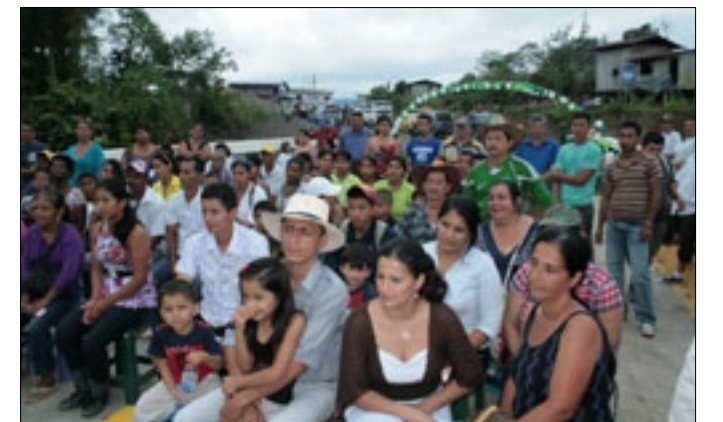
Habitantes de varios sectores se dieron cita a la inauguración