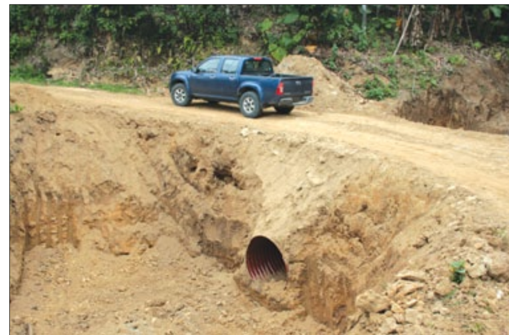
6KM de vía están siendo intervenidos para beneficio de más comunidades de Quinindé

Muy contentos se mostraron los moradores del camino vecinal Nueva Esperanza-Herrera, perteneciente al Cantón Quinindé, debido al aperturado y mejoramiento de 6 kilómetros de vía y la colocación de 8 alcantarillas metálicas con la finalidad de garantizar el mencionado trabajo vial que la Prefectura de Esmeraldas viene realizando en estos sectores. "Nuestro reconocimiento a las autoridades de la Prefectura, por el apoyo brindado, ahora