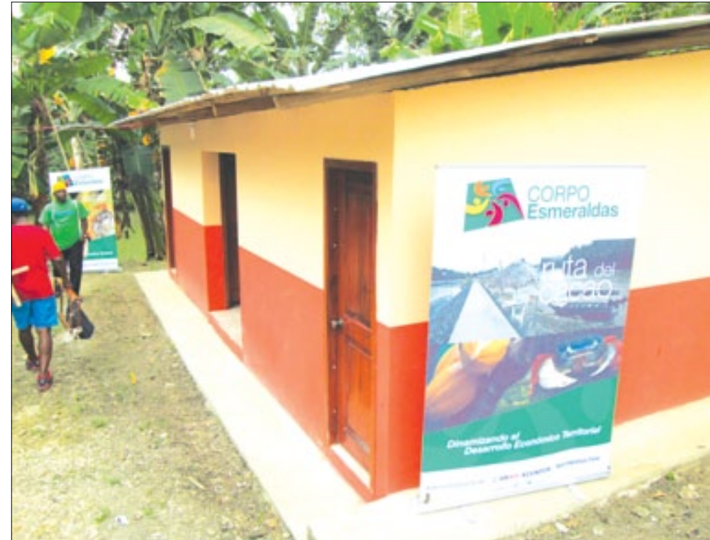
Baterías sanitarias construidas en balneario El Enganche en San Vicente-Rioverde

Con el propósito de fortalecer las actividades relacionadas con el turismo comunitario en todo el cantón Rioverde, el Prefecto Rafael Erazo procedió a realizar la inauguración y entrega de un bloque de baterías sanitarias y cabaña de estancia turística a los habitantes del recinto San Vicente, la obra inaugurada complementa el trabajo que