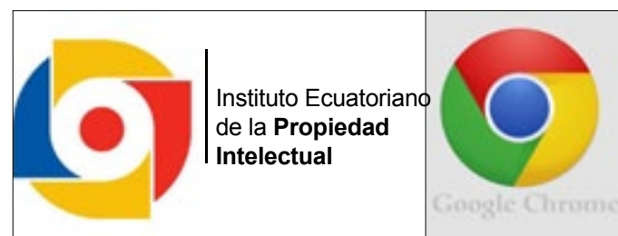
La similitud en el diseño no puede ser coincidencia