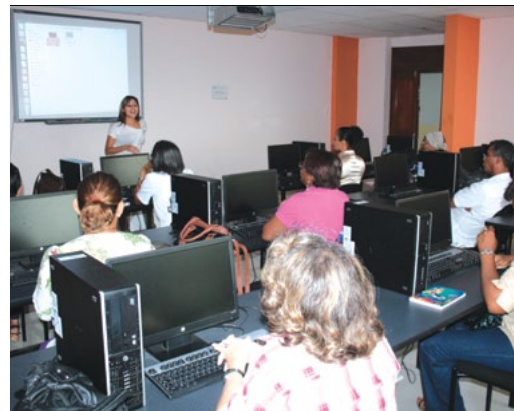
Maestros esmeraldeños en capacitación

Docentes de varios establecimientos educativos de la ciudad Esmeraldas se encuentran participando de los talleres de actualización de conocimientos en el manejo del software libre Ubuntu, facilitado por los técnicos de la Prefectura de Esmeraldas en el aula virtual de la institución.