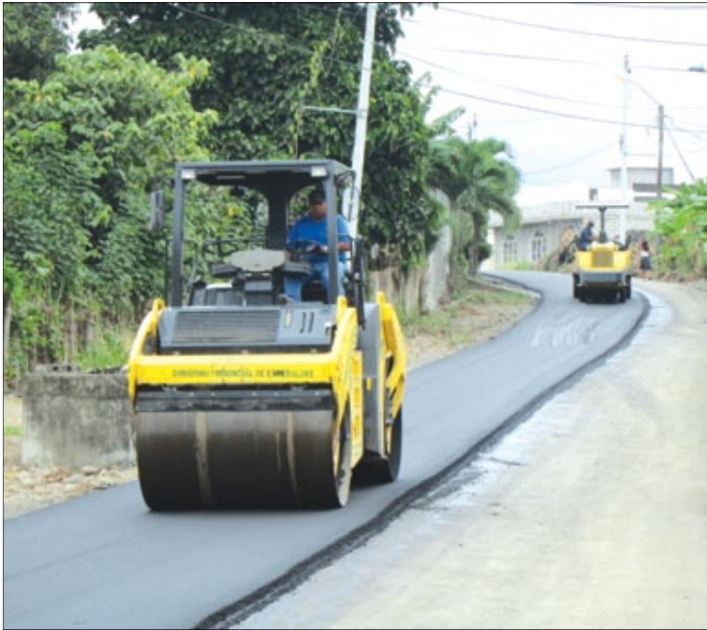
Los habitantes del barrio La Concordia se benefician del asfaltado de sus calles

Conforme lo planificado se desarrollan en varios sectores de la ciudad Esmeraldas los trabajos de bacheo y asfaltado de calles en el marco del convenio entre la Prefectura y Municipio de Esmeraldas, acción que contribuye a dar