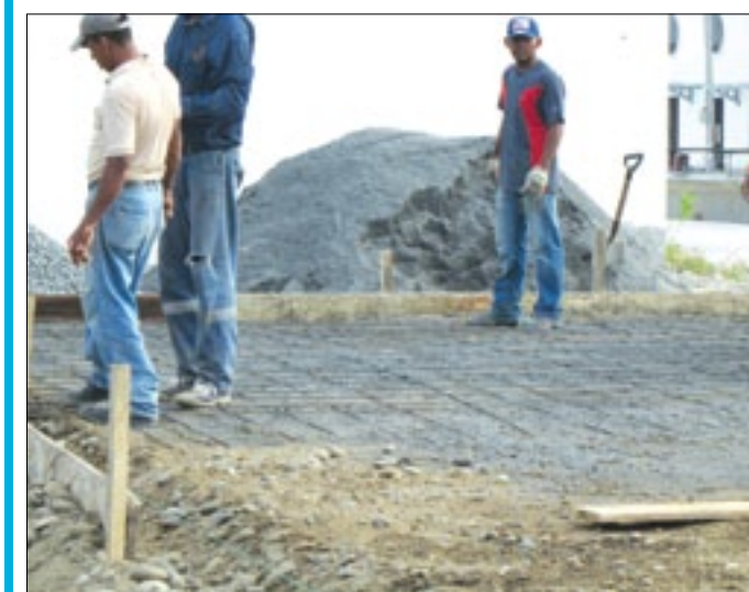
Se aceleran trabajos en la construcción de la fábrica

En la parroquia Rocafuerte en el cantón Rioverde es uno de los sectores de la costa esmeraldeña donde se desarrolla una intensa actividad pesquera, pero como en otros sectores, no cuentan con los implementos necesarios para el buen manejo del producto, es por ello que la Prefectura de Esmeraldas en alianza con los pescadores e instituciones nacionales y extranjeras ejecutan la construcción de una fábrica productora de hielo en escarcha la misma que está por culminada en su primera etapa. Esta estructura albergará máquinas que ya están en el sitio listas para ser ubicadas e iniciar inmediatamente la producción. Esta fábrica no solo producirá hielo en escarcha sino en marquetas, a un costo accesible para los pescadores, con la ventaja que ellos serán quienes administren con una verdadera empresa