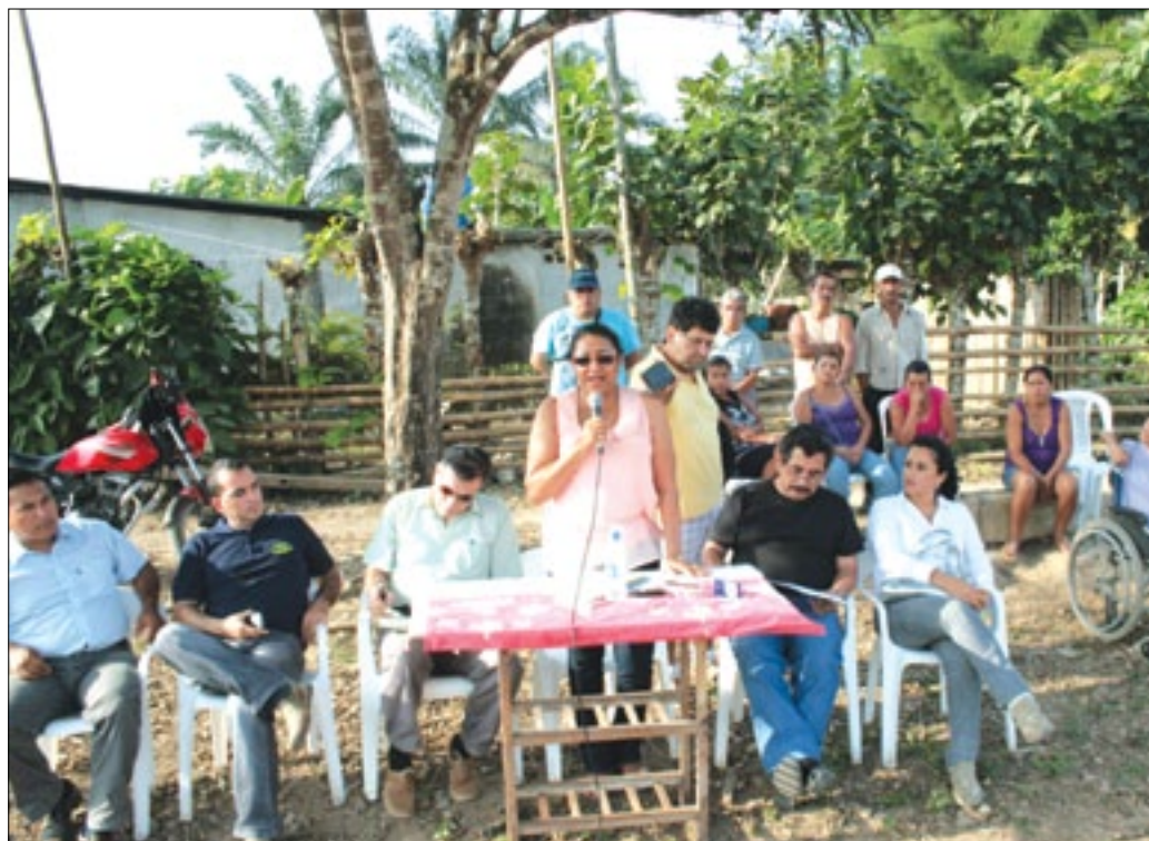
Los campesinos solicitaron a la Vice prefecta el mejoramiento de sus caminos vecinales