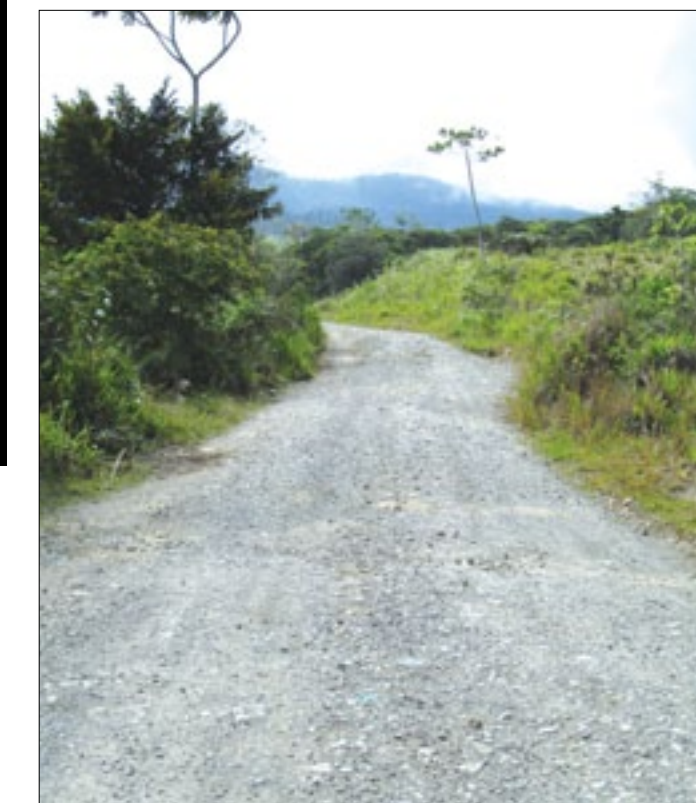
Vía Mirador Unión Manabita-Quinindé

La permanente presencia de lluvias en la zona alta del Cantón Quinindé, ha contribuido al deterioro de los caminos vecinales, así como también al colapso de varias alcantarillas, obstaculizando el tráfico vehicular, como viene sucediendo en la vía Mirador-Unión Manabita, perteneciente al cantón Quinindé. Maquinaria contratada por la Prefectura de Esmeraldas, realiza trabajos de colocación de alcantarillas metálicas para que pueda evacuar el agua estancada en los sitios donde se presentan estas emergencias viales que dificultan la movilidad de los habitantes del Recinto Unión Manabita. Vale destacar que las autoridades de la entidad provincial, siguen atendiendo todas las emergencias que se presenten en los caminos vecinales, de acuerdo al presupuesto económico que tiene la corporación de desarrollo provincial.