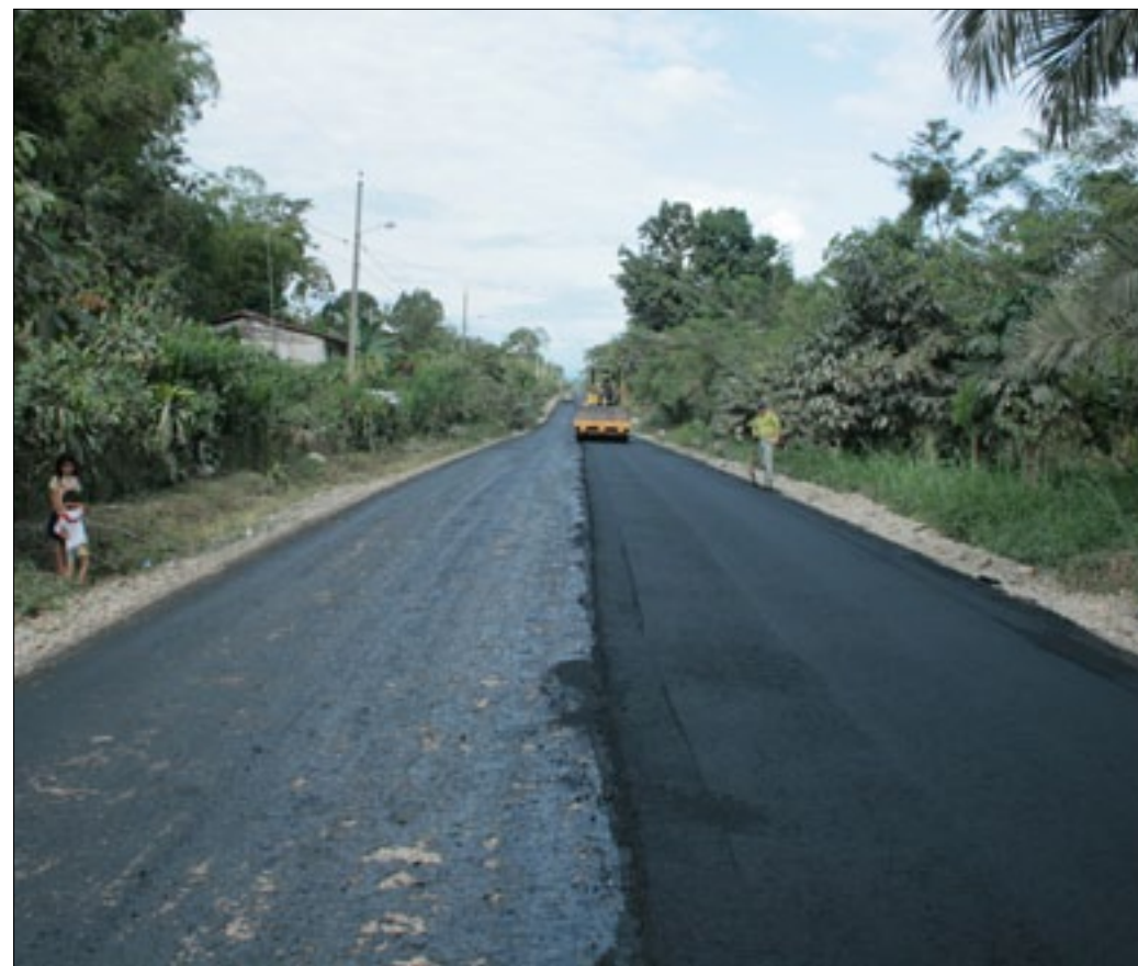
Se realiza la colocación de la carpeta asfáltica

Desde la población El Silencio perteneciente a la Parroquia la Unión de Quinindé se dio inicio a la colocación de material asfáltico, obra vial de 4.7 kilómetros que ejecuta la Prefectura de Esmeraldas presidida y que beneficia a 4