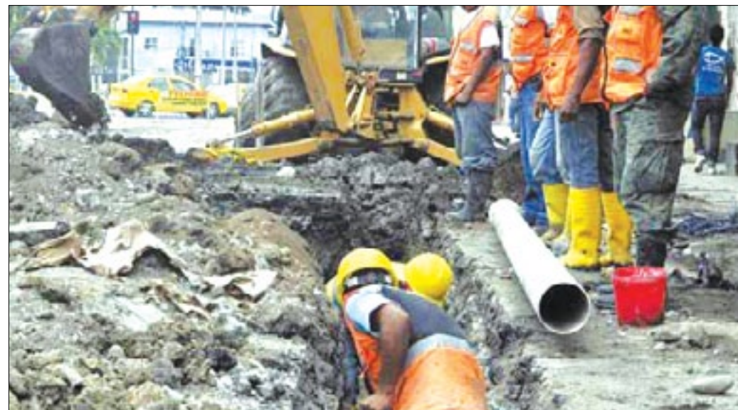
So pretexto del cambio de redes las calles de la ciudad son destruidas

La interrogante que se plantean los esmeraldeños es ¿hasta cuándo tendremos que esperar para que la EAPA culmine estos trabajos? para al fin poder transitar sin impedimento por las calles y avenidas de esta pintoresca ciudad.