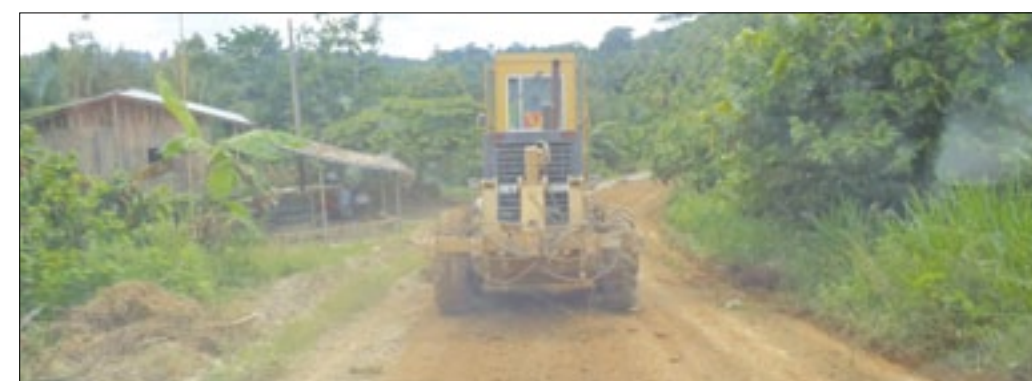
Maquinaria en labores de mantenimiento de la vía

Arduo fue el trabajo que desarrollaron obreros y maquinarias de la Prefectura de Esmeraldas en los 7 km de la vía "E"15 el Progreso en el cantón San Lorenzo.