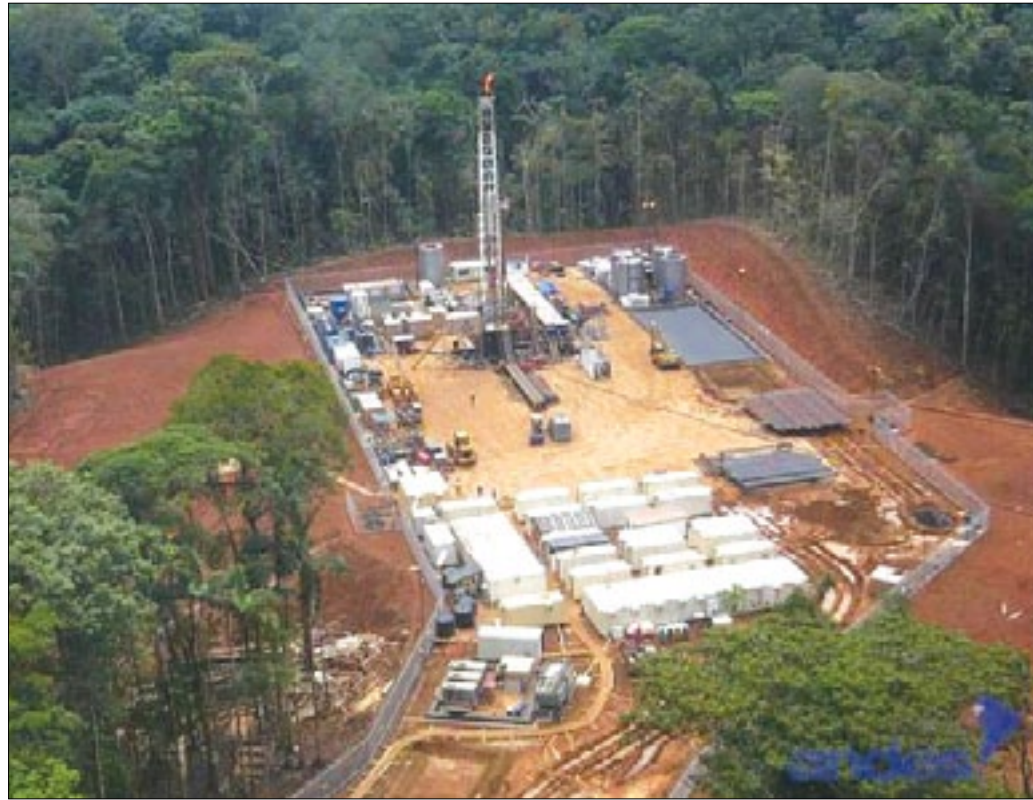
Plataforma petrolera (extracción de crudo)

La defensa de la iniciativa Yasuní ITT está generando un amplio movimiento de protesta; varios sectores, con decisión y venciendo el miedo, exigen al gobierno convocar a consulta popular. El anuncio presidencial de dar paso al plan B y desechar la iniciativa Yasuní- ITT dejó claro que la verdadera intención del correísmo fue siempre explotar el petróleo en esta zona, pese a que ello significa afectar no solo la