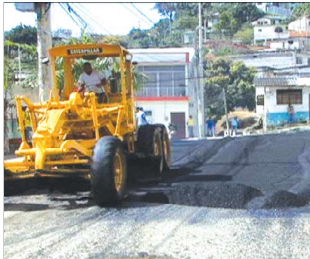
Calles de varios sectores de Esmeraldas son bacheadas con asfalto

No es la primera ocasión que Municipio y Prefectura de Esmeraldas se unen para beneficiar a la comunidad, calles como la Espejo, Salinas, Pedro Vicente Maldonado y otras fueron asfaltadas, pero al poco tiempo estas mismas calles fueron destruidas debido a los trabajos iniciados hace más de 2 años por la empresa de agua potable dejándolas