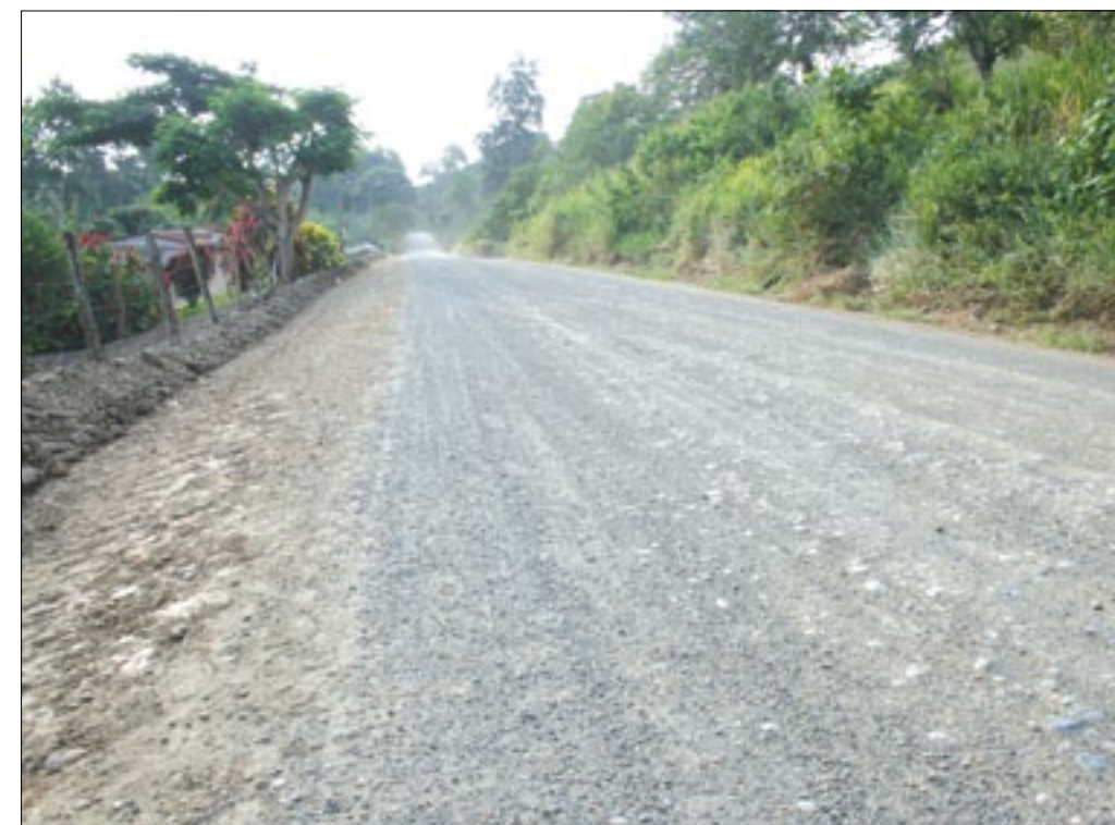
Vía expedita lastrada por maquinaria de la Prefectura de Esmeraldas

Los habitantes de las comunidades beneficiadas con el lastrado de 6 KM. de la carretera Tonsupa - Taseche