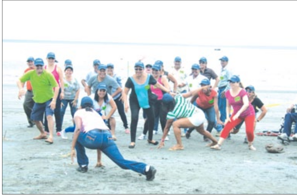
Empleados participando de las dinámicas en el taller

Con el propósito de estimular y fortalecer los nexos de trabajo entre el personal que forma parte del equipo administrativo de la Prefectura de Esmeraldas, se cumplió en el balneario de la parroquia Rocafuerte,