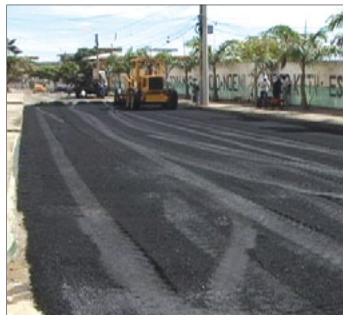
Prefectura y Municipio de Esmeraldas una vez asfaltan calles