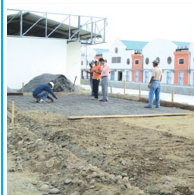
Construcción de las instalaciones para fábrica de hielo