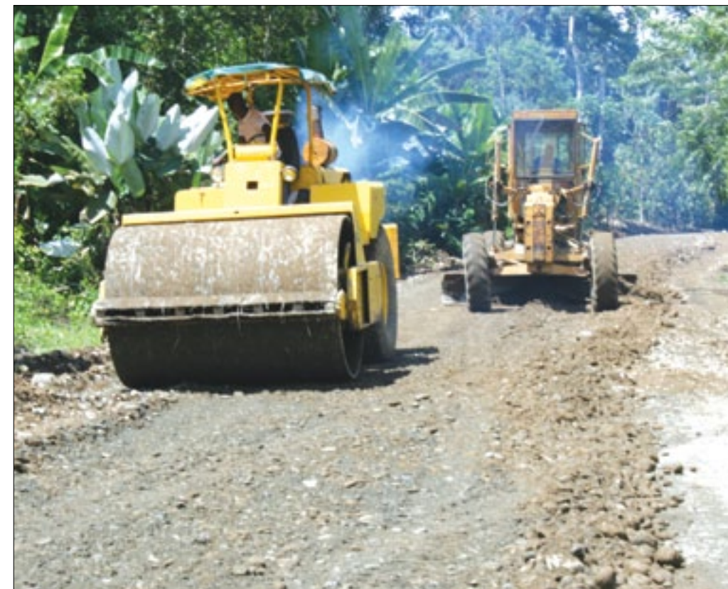
En pocas semanas estarán finalizados los trabajos en esta vía

Finalizados los trabajos de asfaltado de los 14 km de la vía Maldonado Timbiré en el cantón Eloy Alfaro, autoridades de la Prefectura se preparan para la inauguración de esta importante arteria vial de la zona norte de la provincia. Cabe señalar que esta carretera ya está siendo usada por los transportistas y moradores lo que permite a propios y extraños movilizarse sin contratiempos, los habitantes de estos sectores se encuentran satisfechos por el asfaltado de esta vía y están a la espera de la inauguración y además de que se avance con el asfaltado hasta la comunidad de Selva Alegre, trabajos que se retomarán en los próximos días manifestó el Prefecto.