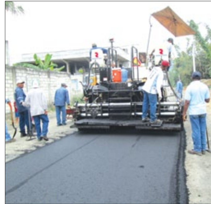
Obreros de la Prefectura asfaltando barrio La Concordia

De su parte los técnicos responsables de los trabajos han destacado las disposiciones proporcionadas por autoridades de la Prefectura y Municipio de Esmeraldas, en el sentido avanzar en el mejoramiento integral de las calles hasta antes del inicio de la estación invernal, priorizando las que se presenten más afectadas.