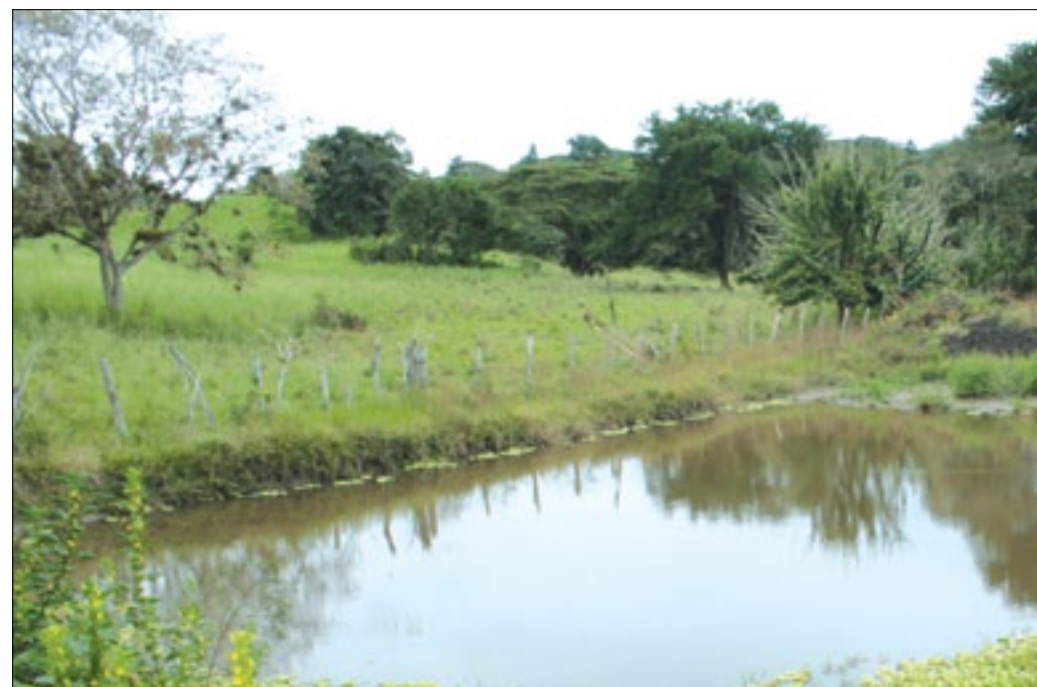
Albarrada en el recinto La Muralla-Rioverde

La Prefectura de Esmeraldas, a través del área de Riego y Drenajes de Gestión Ambiental, viene construyendo y mejorando albarradas en varios cantones de la provincia, con la finalidad de que los agricultores especialmente los ganaderos puedan almacenar el líquido vital para la época de verano donde el ganado padece por la sequía ocasionada por falta de lluvias.