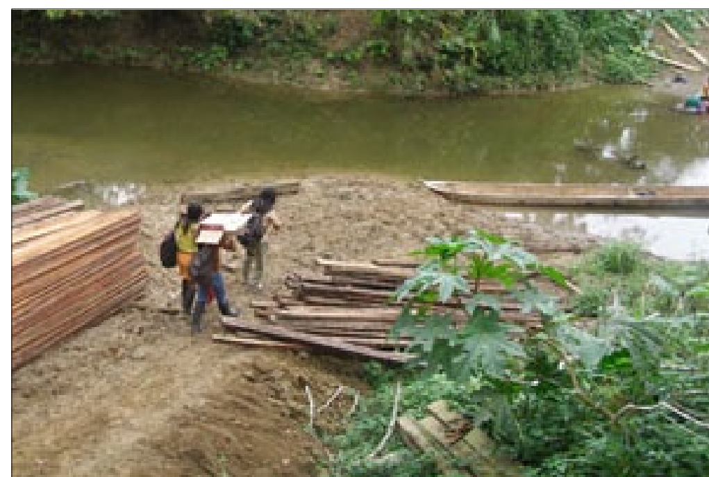
Río Boca del Sucio-Muisne

Una vez emitida la autorización por el Ministerio del Ambiente a la Prefectura de Esmeraldas para la construcción del puente sobre el río Boca del Sucio, se cumplen los procesos para la contratación del profesional o empresa que se encargará de construir dicha obra.