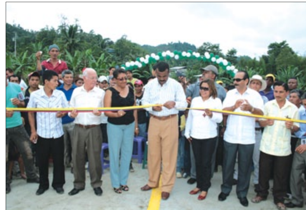
Autoridades de la Prefectura y Municipio de Quinindé inaugurando el puente.

obra que beneficia a comunidades de tres cantones de la provincia