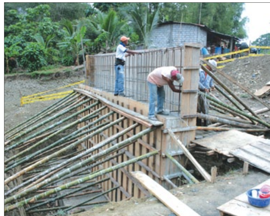
Se realiza la fundición de la base que soportará el puente

En un 30%, avanza la construcción del puente de 40 metros luz, sobre el río Tabete, ubicado en el trayecto vial Chigüe-Casa de Mono de la Parroquia Chingü del Cantón Esmeraldas, obra que ejecuta